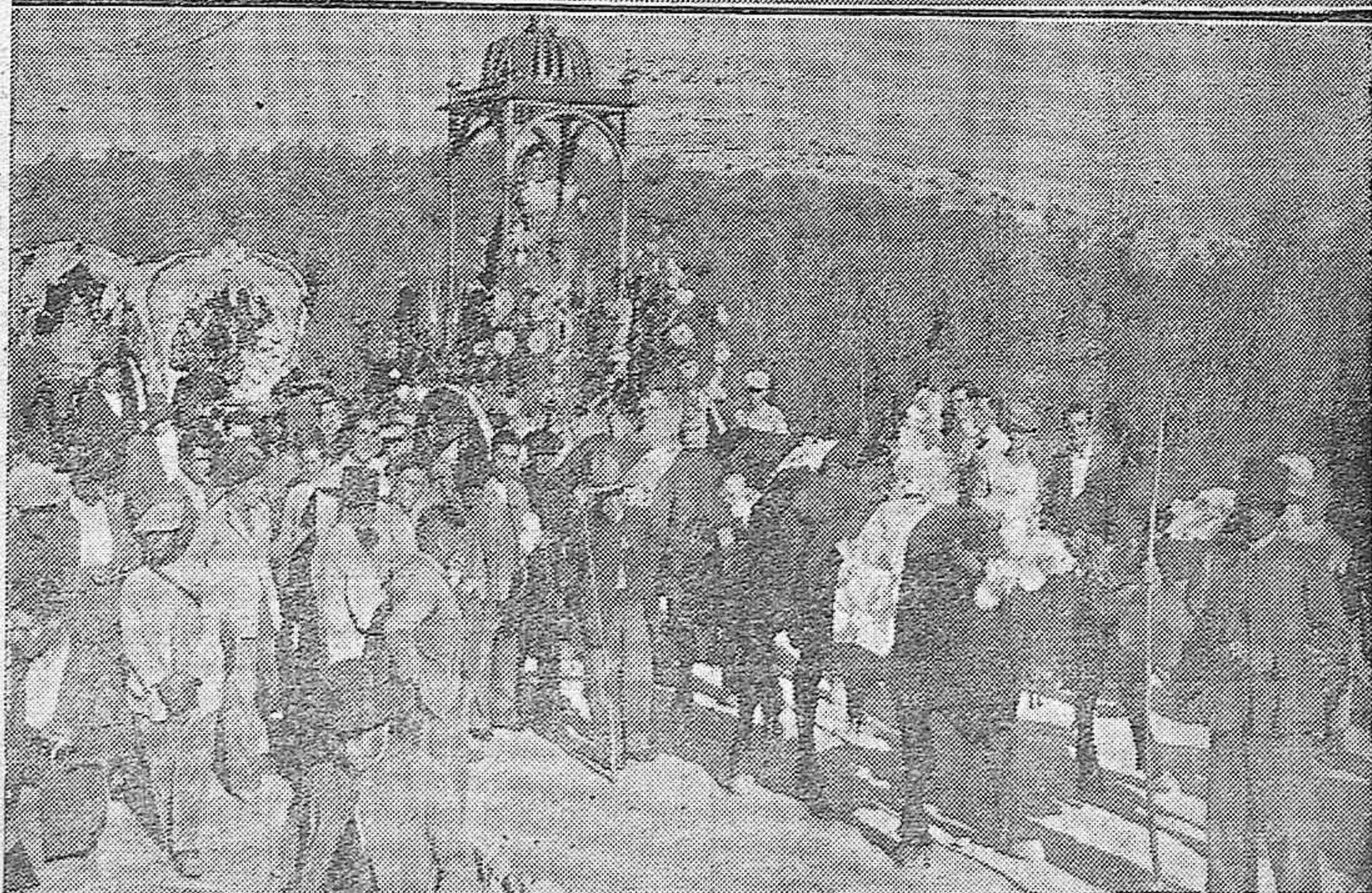
Arriba: Aeroplano militar que se estrelló contra el muro que circunda el Stadium Electromecánica, resultando con grandes desperfectos.—Abajo: Un detalle de la procesión y romería de la Virgen de Anaceli en Lucena.