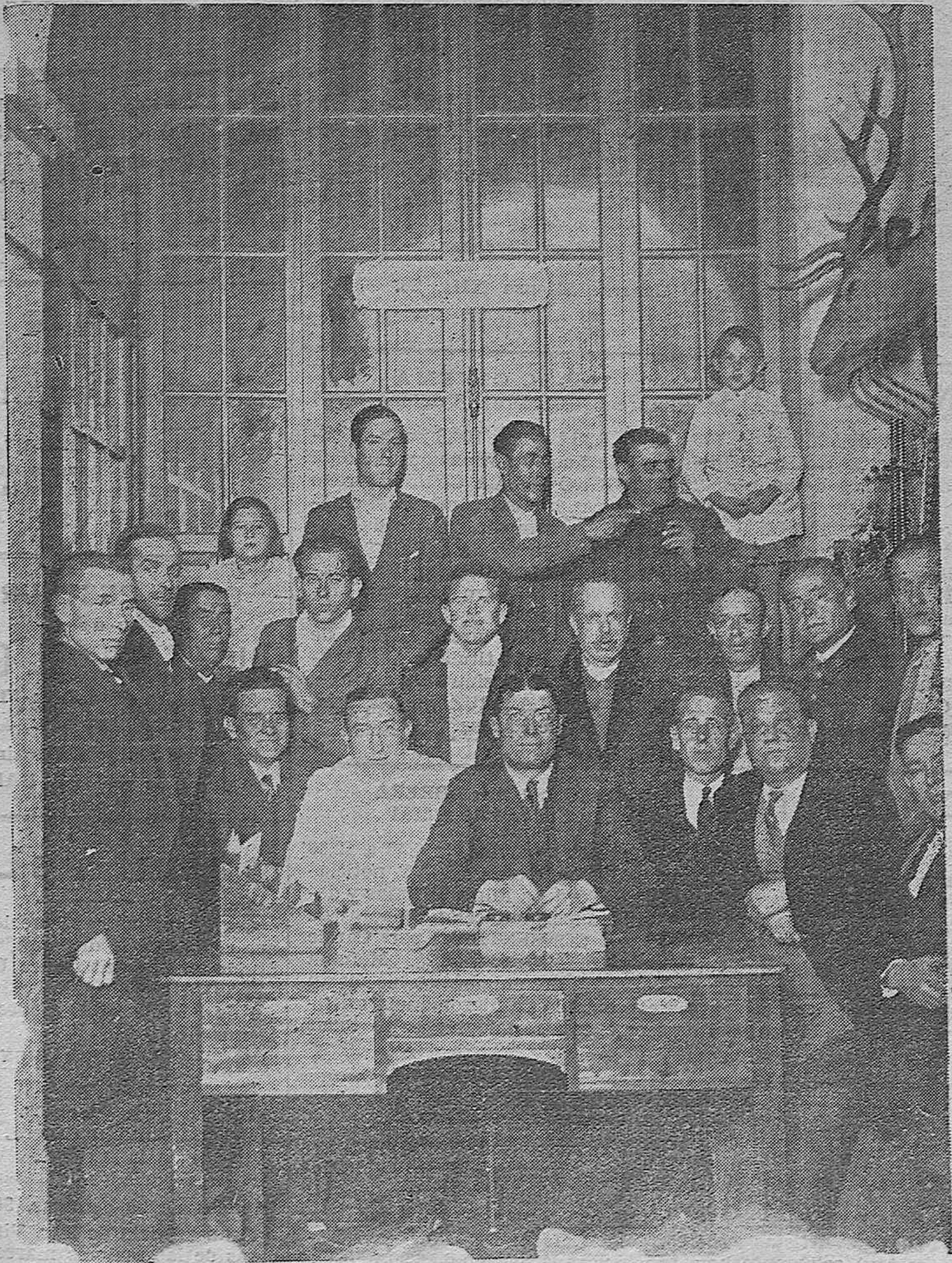
NOTA GRAFICA.—La nueva directiva de la Sociedad de Caza y Pesca, con algunos de los socios después de la Junta general. (Fotos Santes).