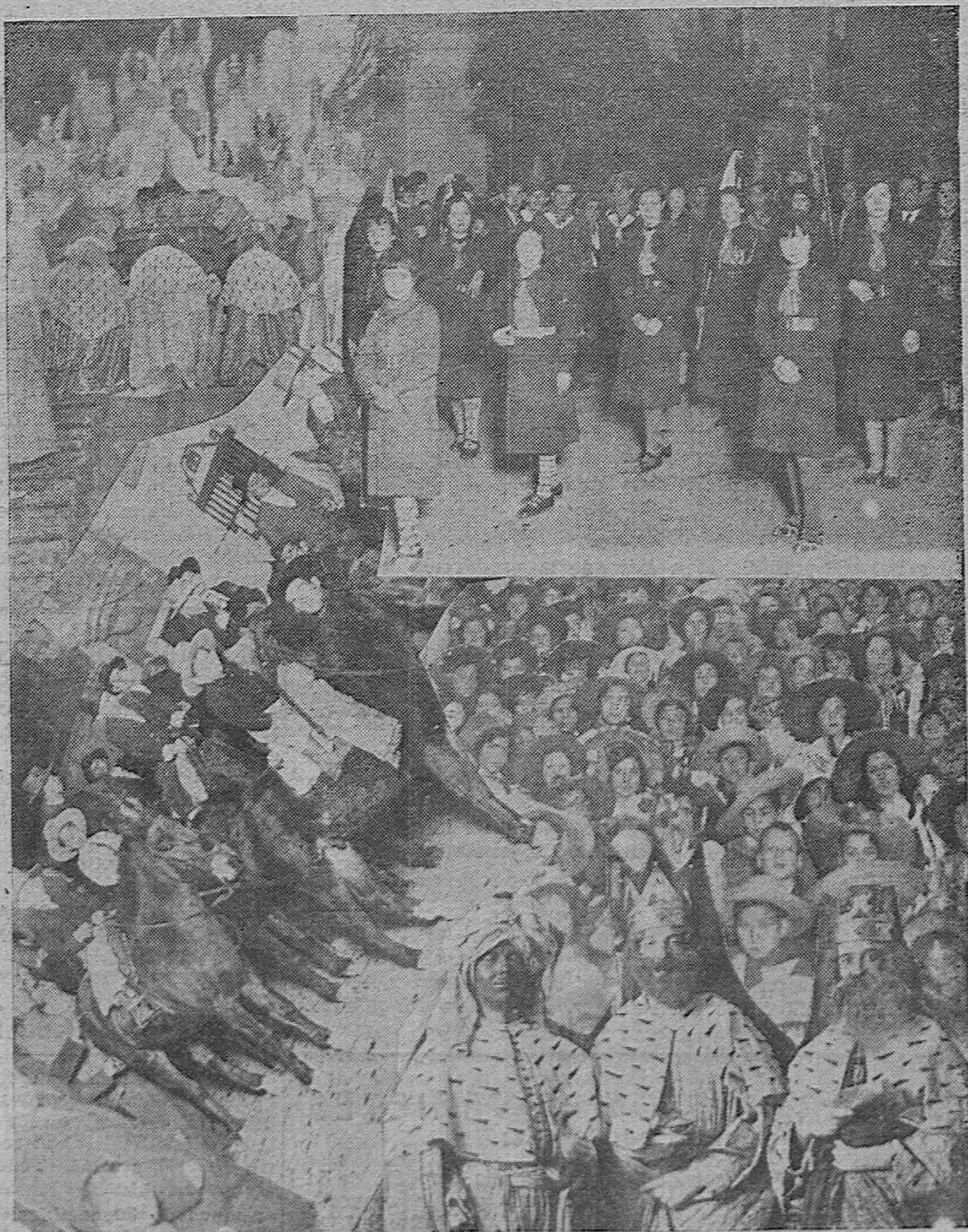
Varios detalles de la Cabalgata de los Reyes Magos, que tan brillantemente desfilaron por la ciudad en la noche del sábado