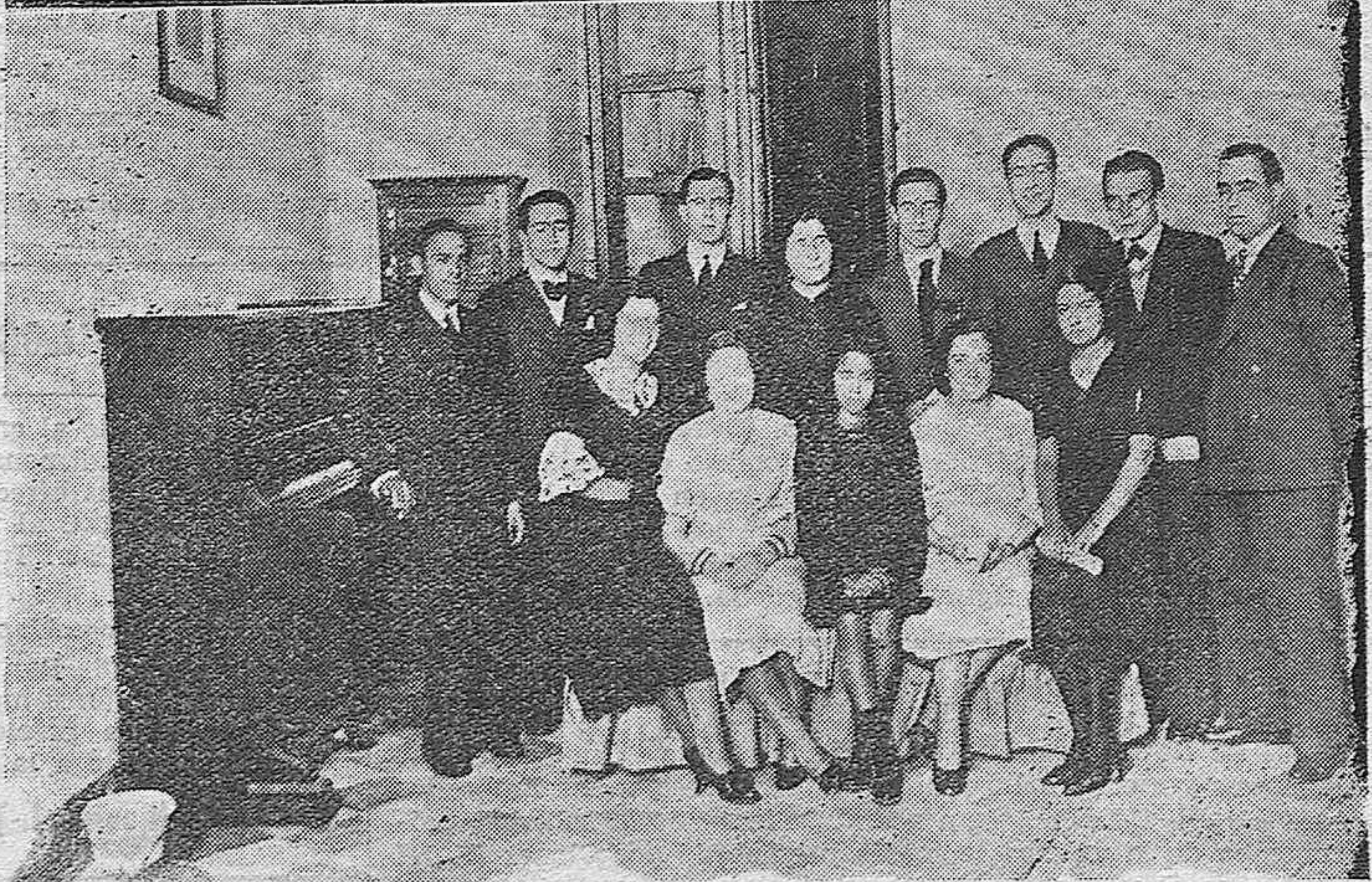
NOTAS GRAFICAS. —Los alumnos de la Asociación de Estudiantes de Música del Conservatorio, celebraron anoche en dicho Centro oficial un concierto, con motivo de la fiesta de la Patrona. Un detalle del acto.