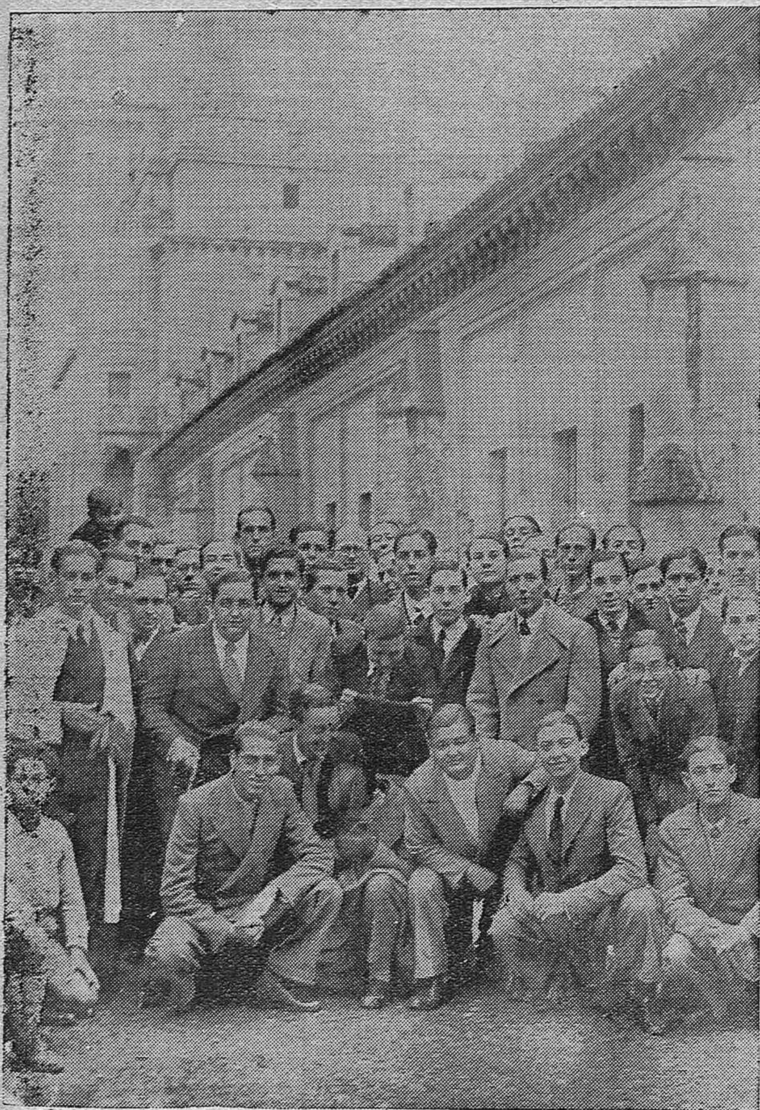
Alumnos del sexto año del Bachillerato del Instituto Nacional durante la visita que realizaron para estudiar la Mezquita Única.