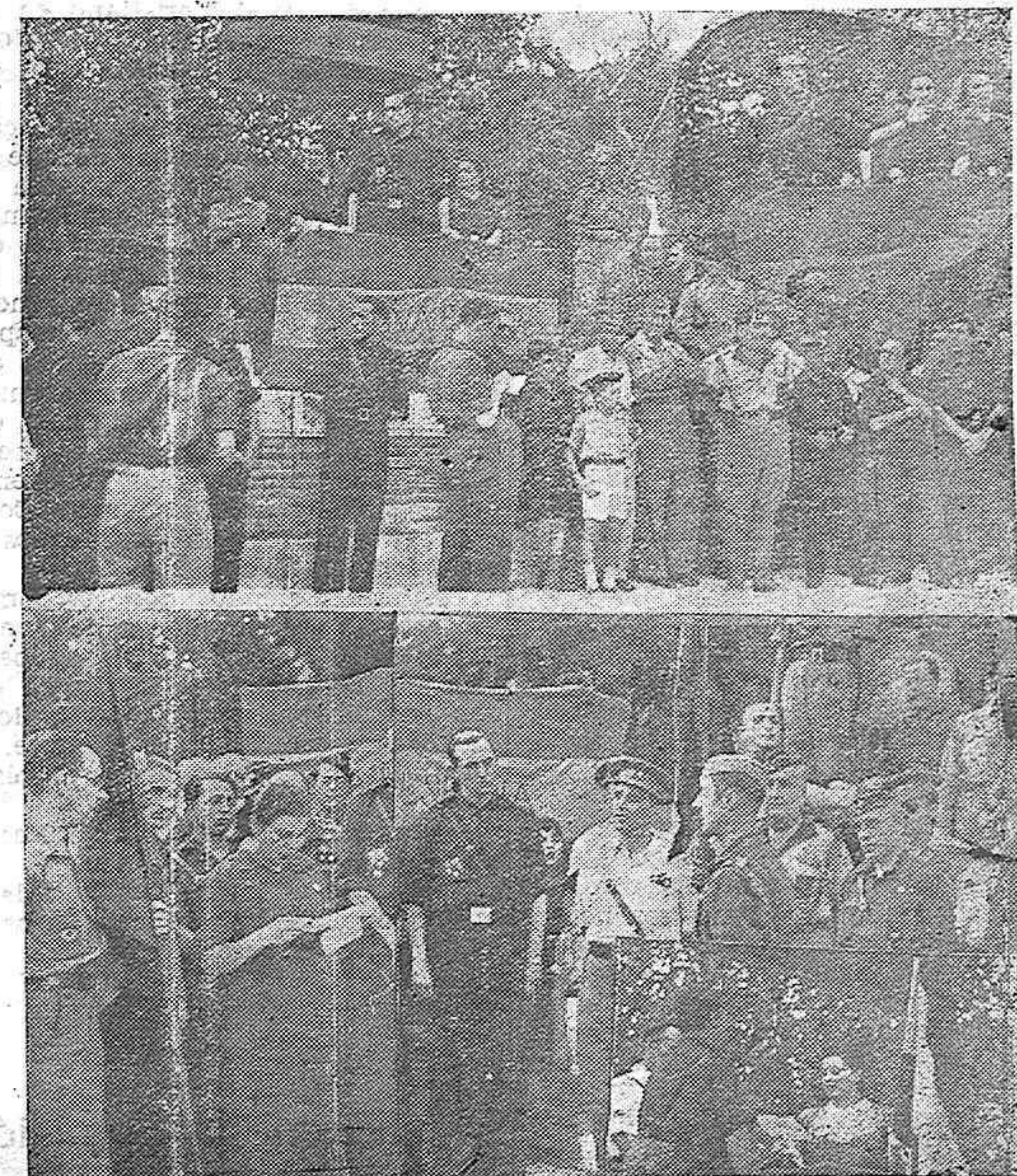
EL DIA DE FALANGE EN BAENA. A LA IZQUIERDA, EL CAUDILLO EN EL DIA DE LA FALANGE EN BAENA. CUATRO DALLS DE LOS ACTOS REALIZADOS Y DE LOS QUE NO OCUPAMOS EN ESTE NUMERO DE "AZUL".