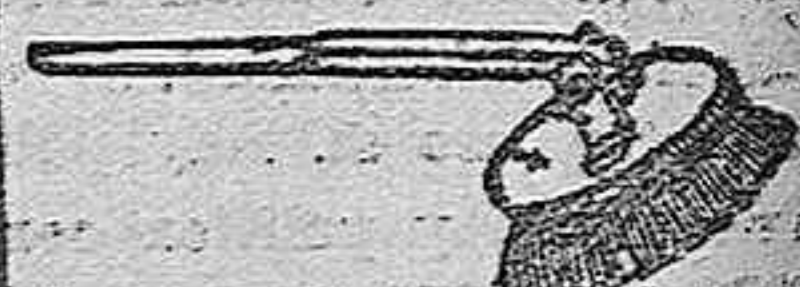
Modelo registrado n.º 296