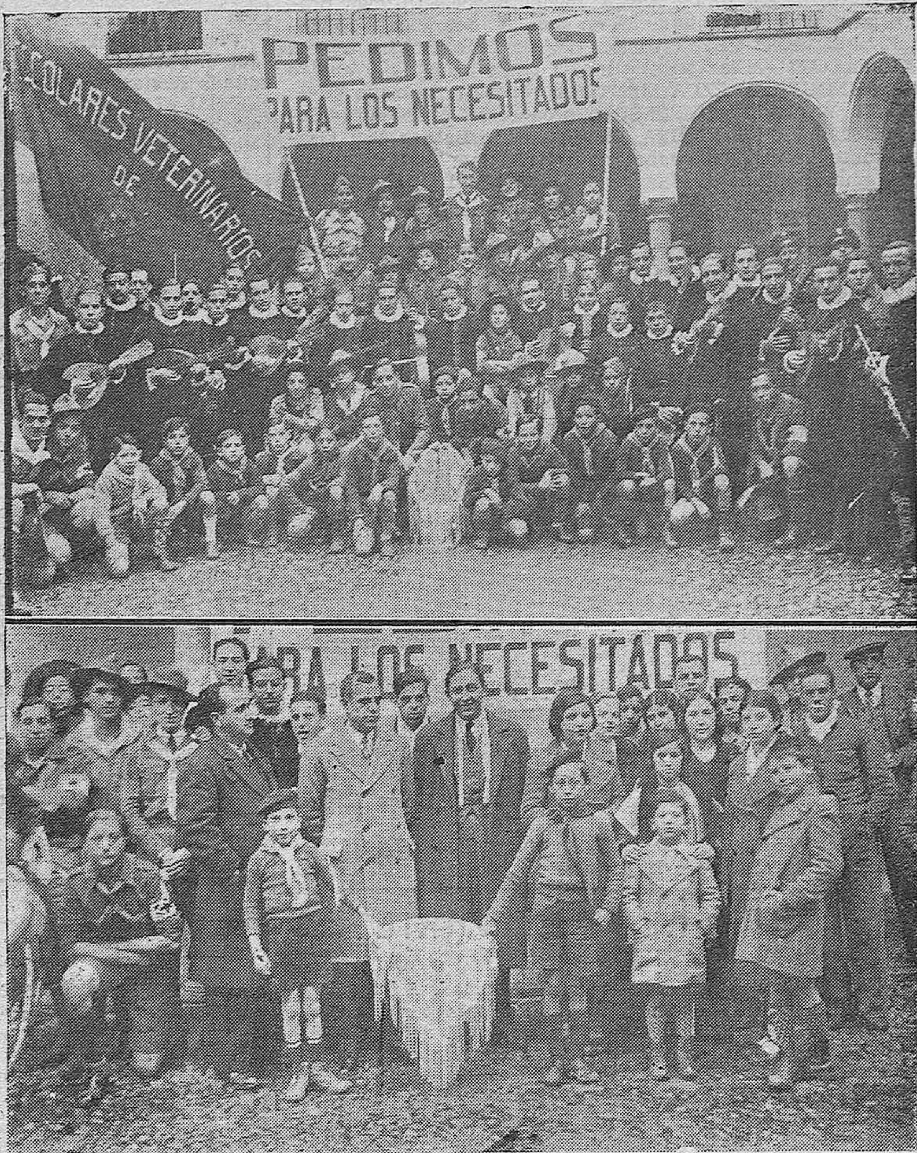
Postulación a favor del Comedor de Caridad, Asilos y donativos a los niños de Villaviciosa.—La Comisión organizadora con las bellas señoritas que postularon en unión de la Estudiantina Escolar Veterinaria y elementos que tomaron parte en la postulación que fué lucidísima.