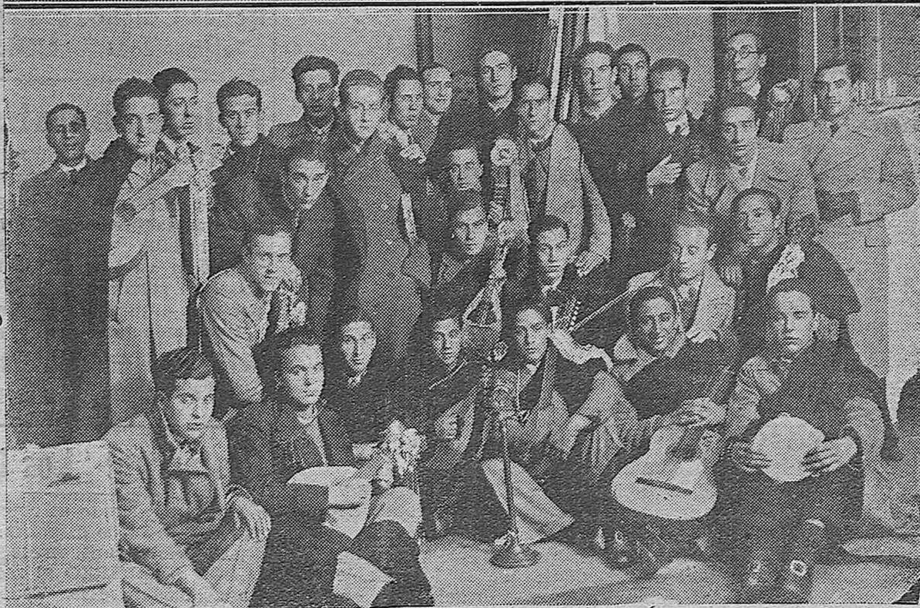
En el Salón de actos del Ayuntamiento se celebró anoche la Asamblea de Funcionarios Municipales.—Presidencia del acto.—La Tuna Escolar Salmantina de la Universidad de Salamanca durante el hermoso concierto que dió anoche ante el microfono de nuestra Emisora E. A. J. 24 con motivo de su estancia en esta capital.