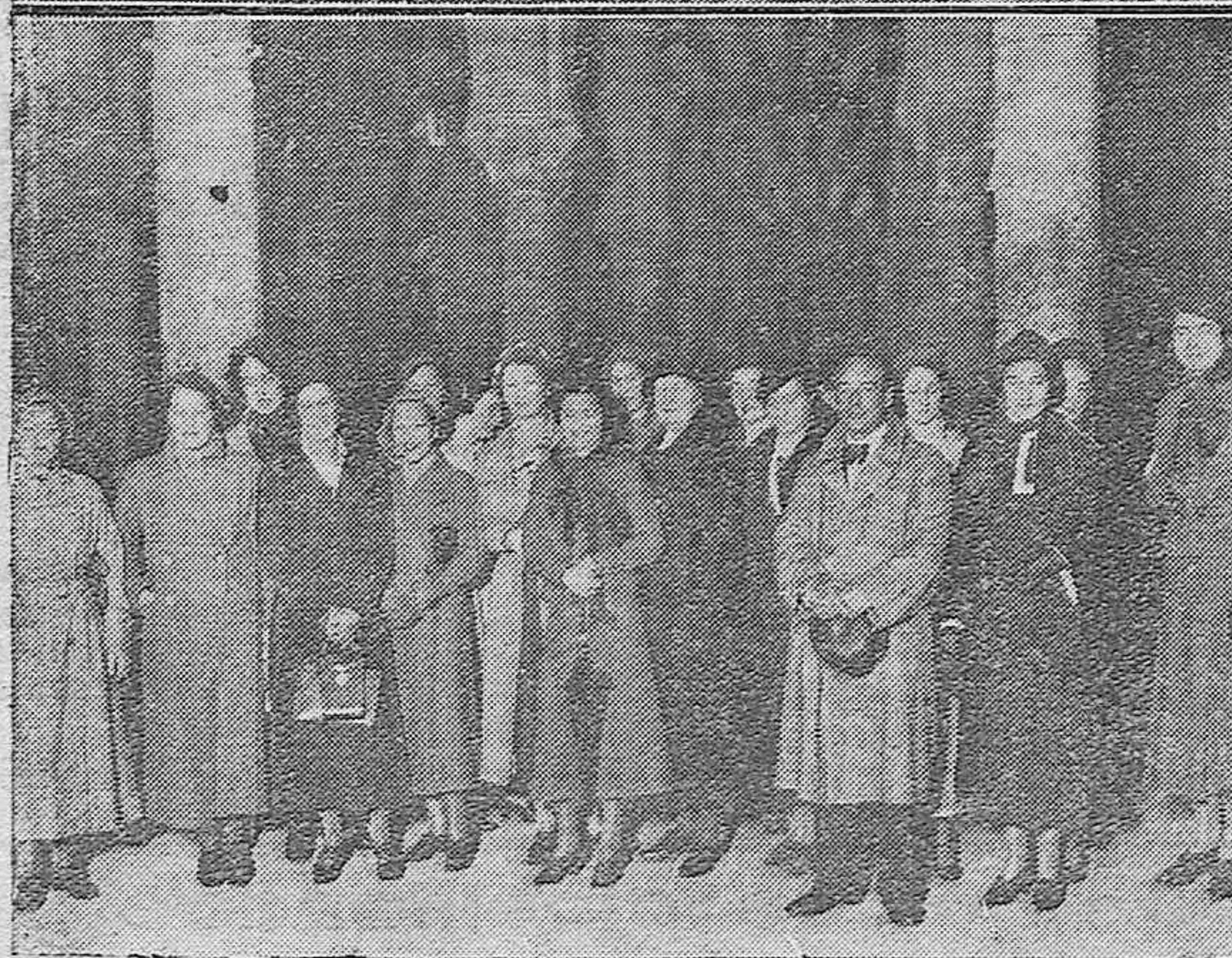
Arriba: Aspecto del Molinillo de Sansueña durante la Romería a Santo Domingo el último día de la fiesta.—Abajo: Bellas alumnas del Instituto Femenino de la Magdalena de París acompañadas de su directora señora Hebert, que acaban de llegar a Córdoba en viaje de estudios.