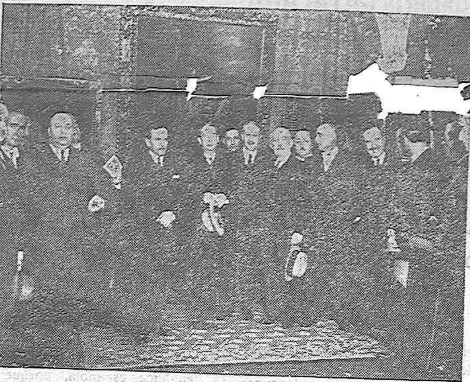
Ilustres personalidades que asistieron al acto de la inauguración

Recuerda, visiblemente emocionado, cuando paseaba noctámbulo, con el