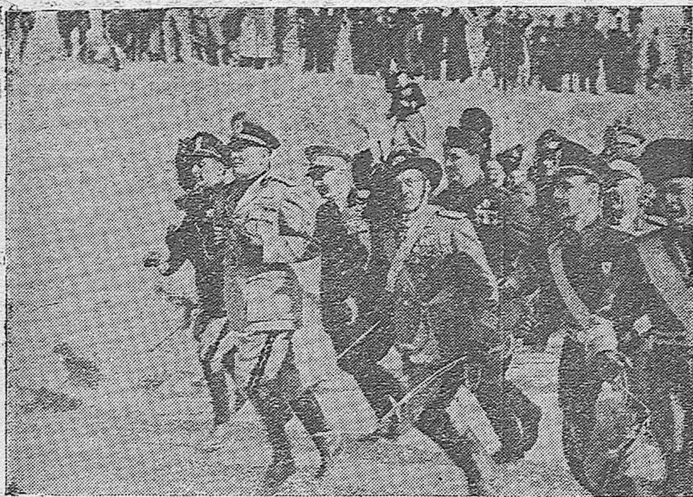
En Gradisco, el Duce marchó a paso de carrera, a la cabeza de los Bersaglieri.