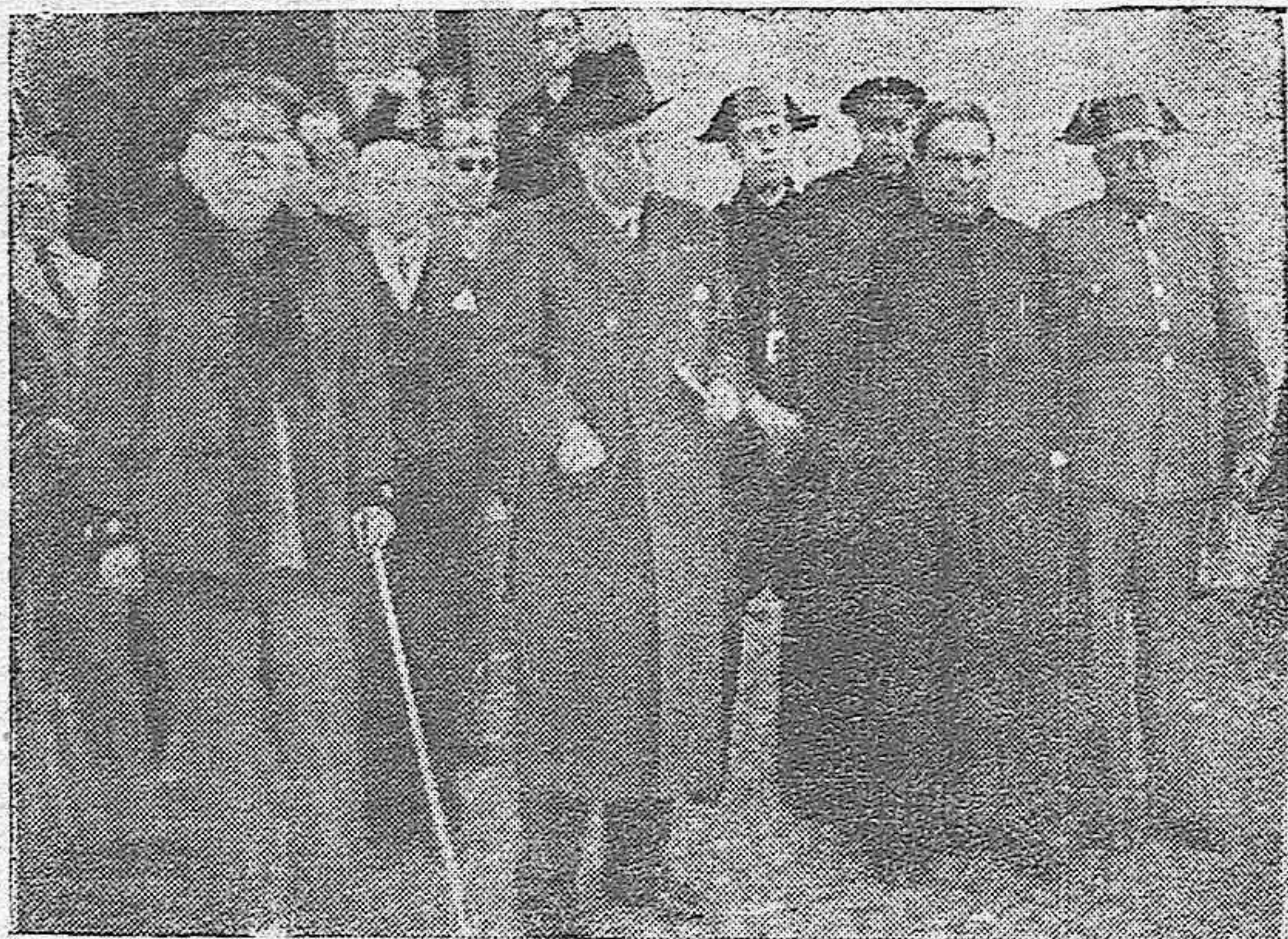
PRESIDENCIA DE LA FIESTA RELIGIOSA CELEBRADA EL DOMINGO EN LA PARROQUIA DE SAN JOSE (CAMPO DE LA VERDAD), EN HONOR DEL SANTO CRISTO DEL DESCENDIMIENTO