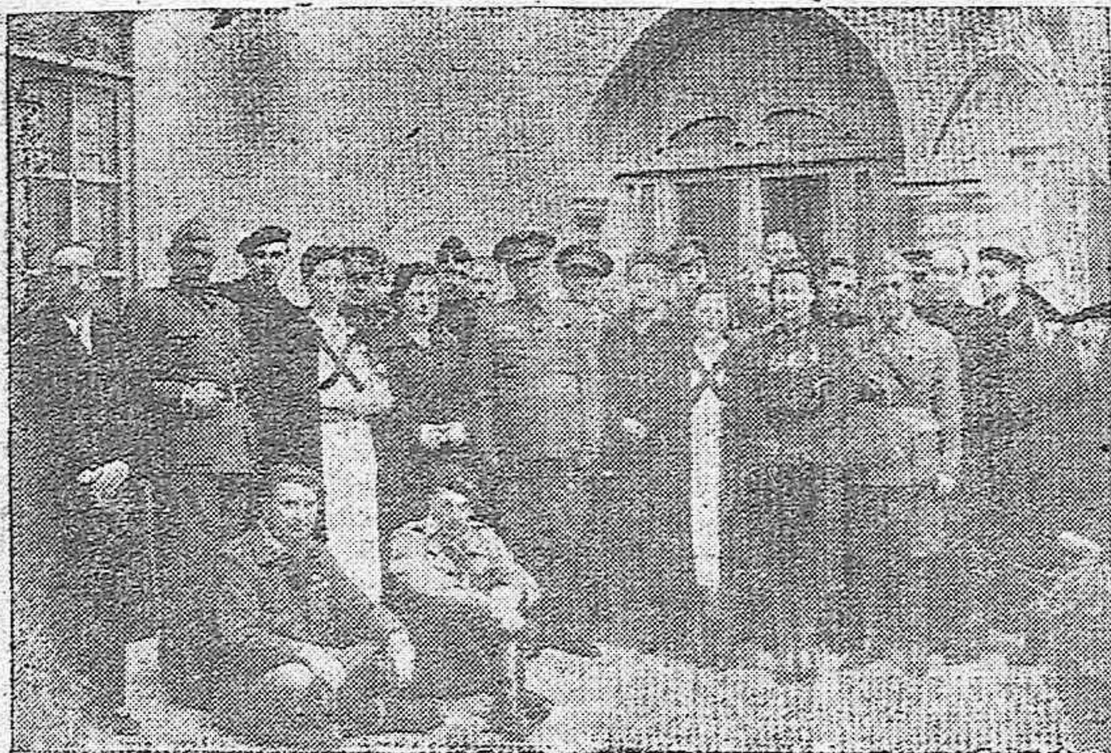
BUJALANCE.—Inauguración del Casino Militar. Las autoridades que asistieron al acto, y la concurrencia.