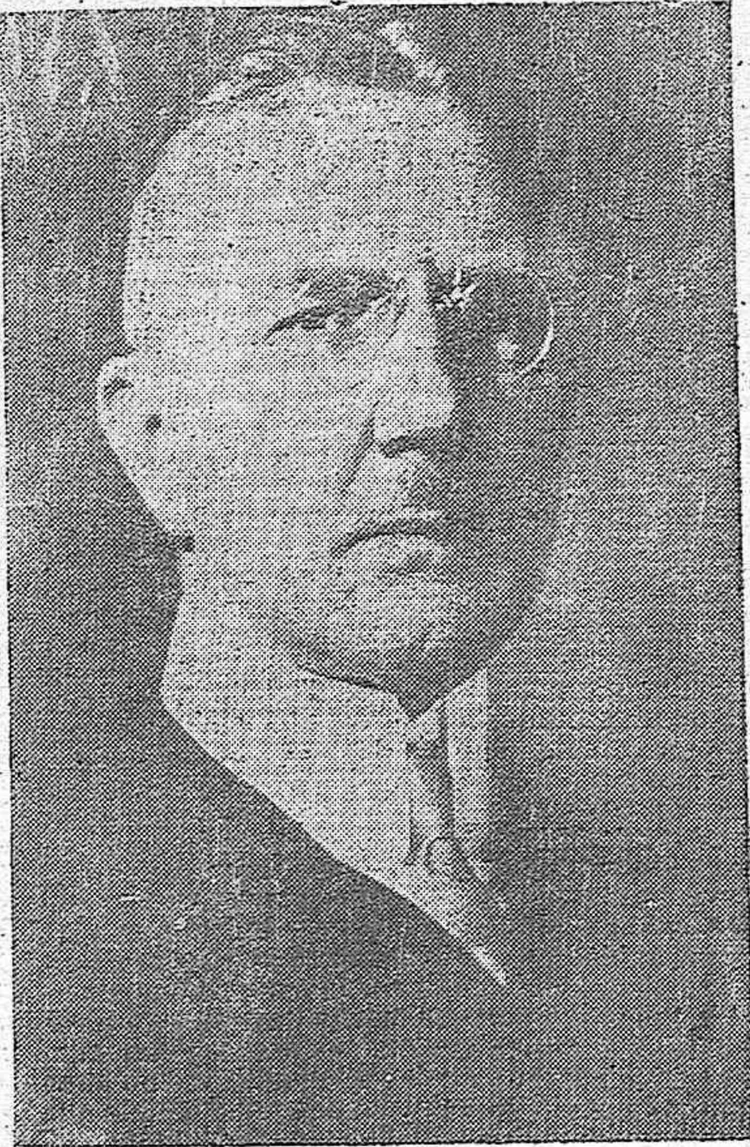
El Dr. Hjalmar Schacht, Presidente del Reichsbank

¡Contribuye a la suscripción Pro-Sanatorio-Enfermería Antituberculoso de Córdoba!