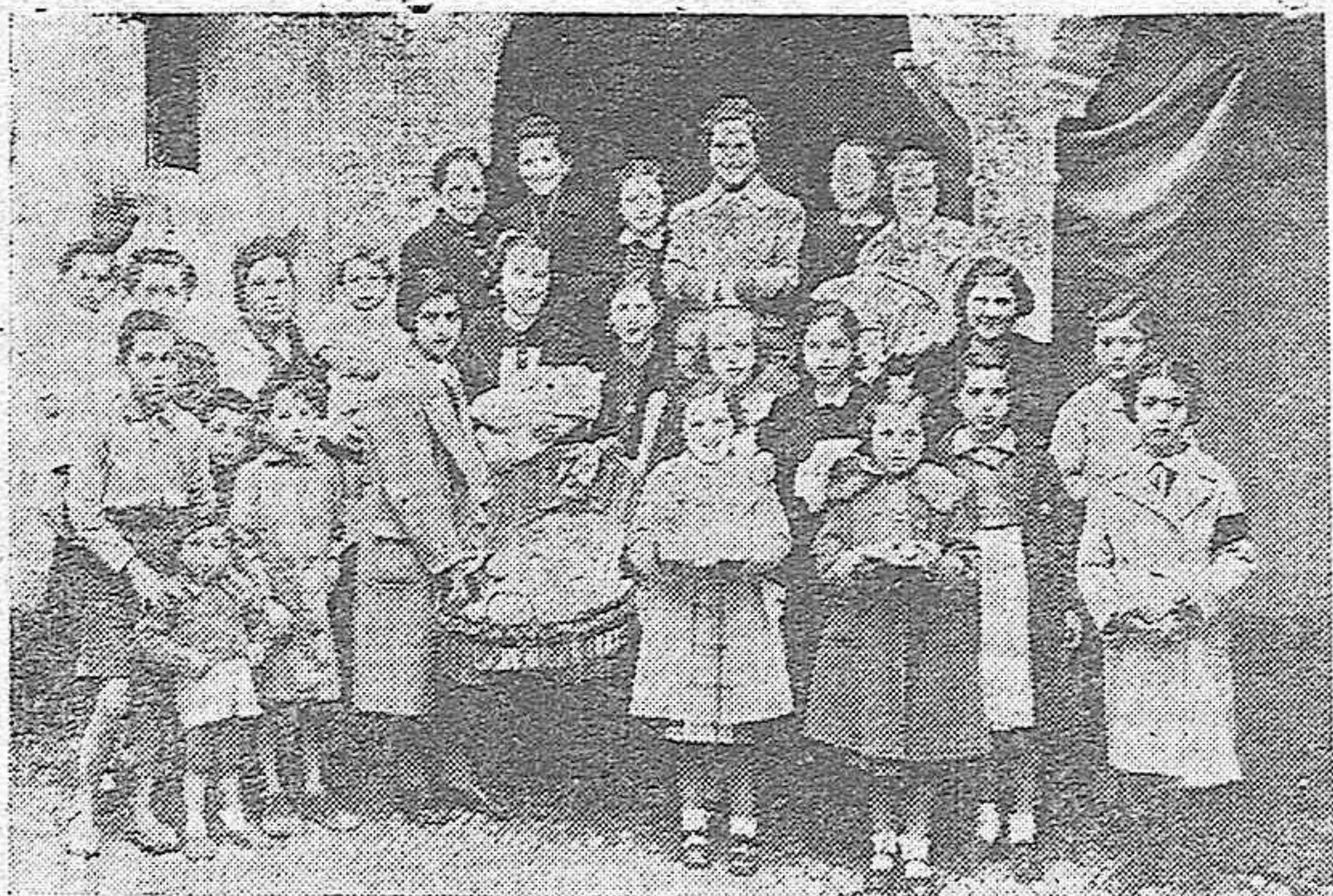
Las damas catequistas de Córdoba, entregaron una canastilla para una niña nacida el día de Nochebuena y cuya madre asiste a las clases de dicha institución.