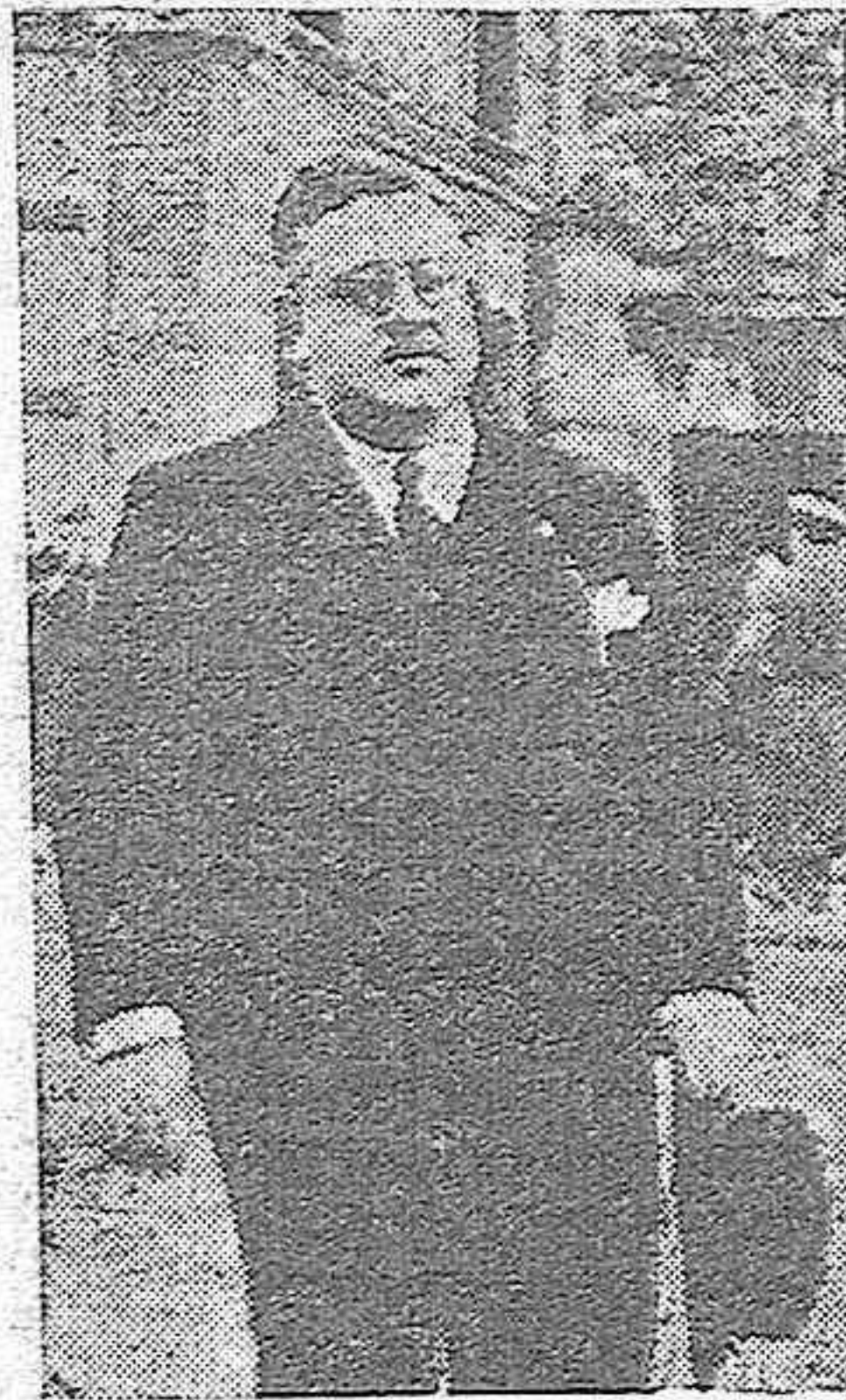
El Ministro de Educación Nacional señor Sainz Rodríguez.

fin de las Enseñanzas Primaria y Media, momentos principales de orientación para el porvenir educativo y profesional de los jóvenes; complementándose con una vigilancia que deberá seguir año por año el aprovechamiento y la aplicación de los escolares seleccionados, a fin de que esta protección del Estado no asuma el carácter de dona-