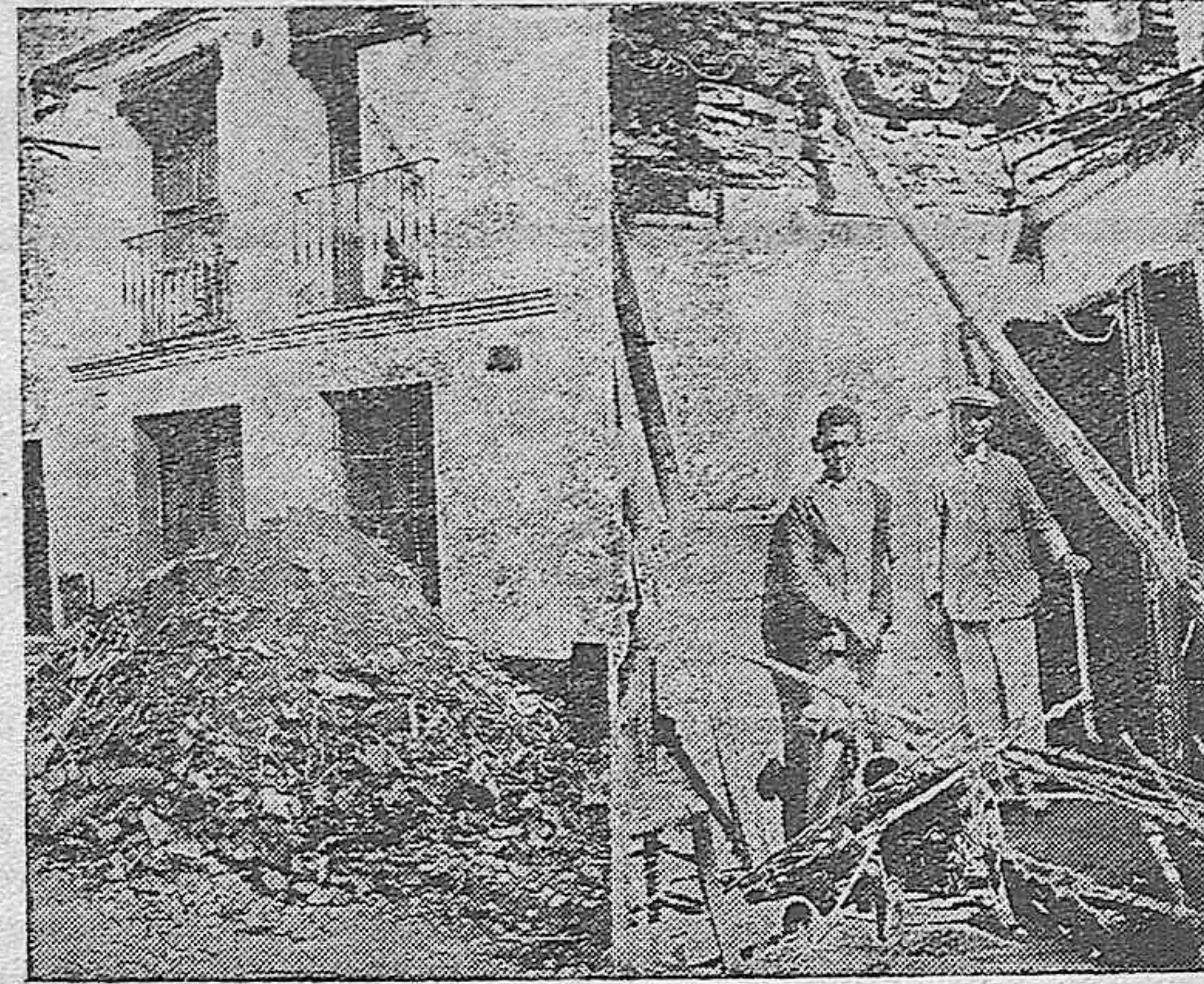
Derrumbamiento de la casa número 159 de la calle Santiago, y que, por fortuna, no hubo que lamentar desgracias personales. Uno de los rincones de la parte alta, donde no ha quedado servible ni un solo mueble.