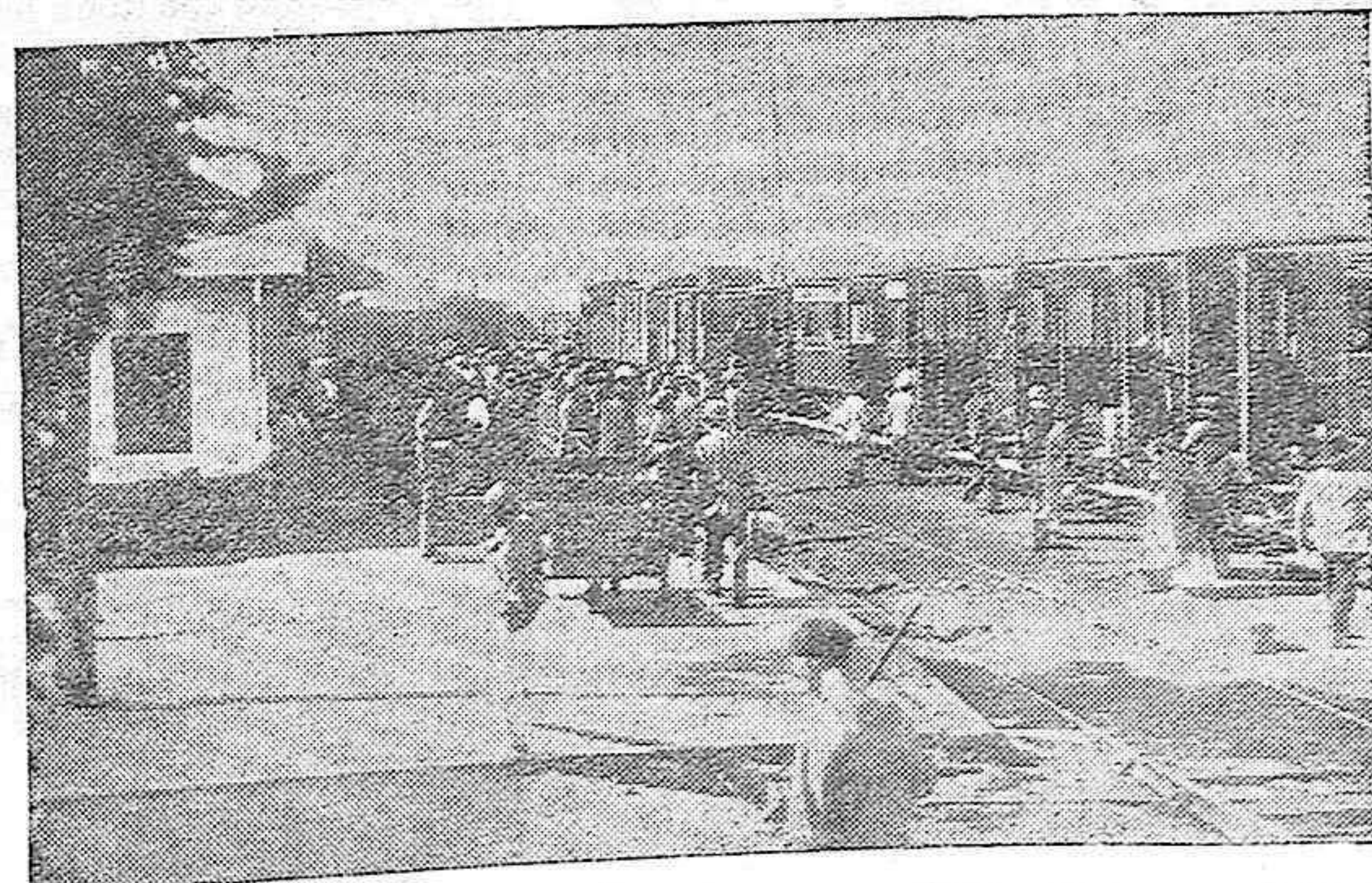
Aspecto de la estación de Cercadilla al llegar el correo de la Sierra, estando custodiada la estación por fuerza pública.