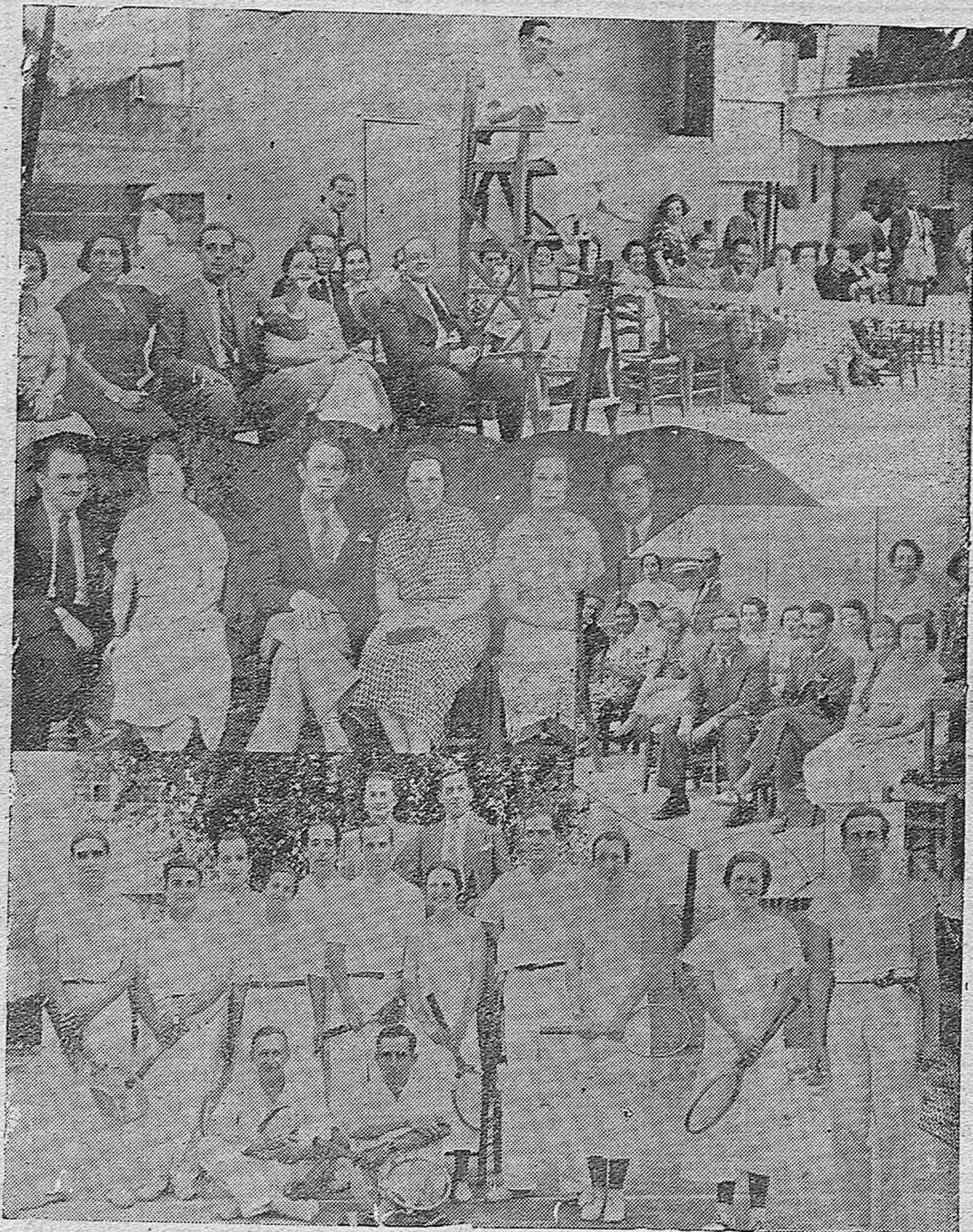
EN EL CAMPO DE TENNIS CLUB.—Partidos Inter-Club entre los equipos Bétis Tennis Club y Tennis Club Córdoba.—Bellas señoritas presenciando las interesantes jugadas.—Los equipos sevillano y cordobés, de los cuales quedaron vencedores los segundos, en las jugadas de singles, dobles damas y dobles caballeros.