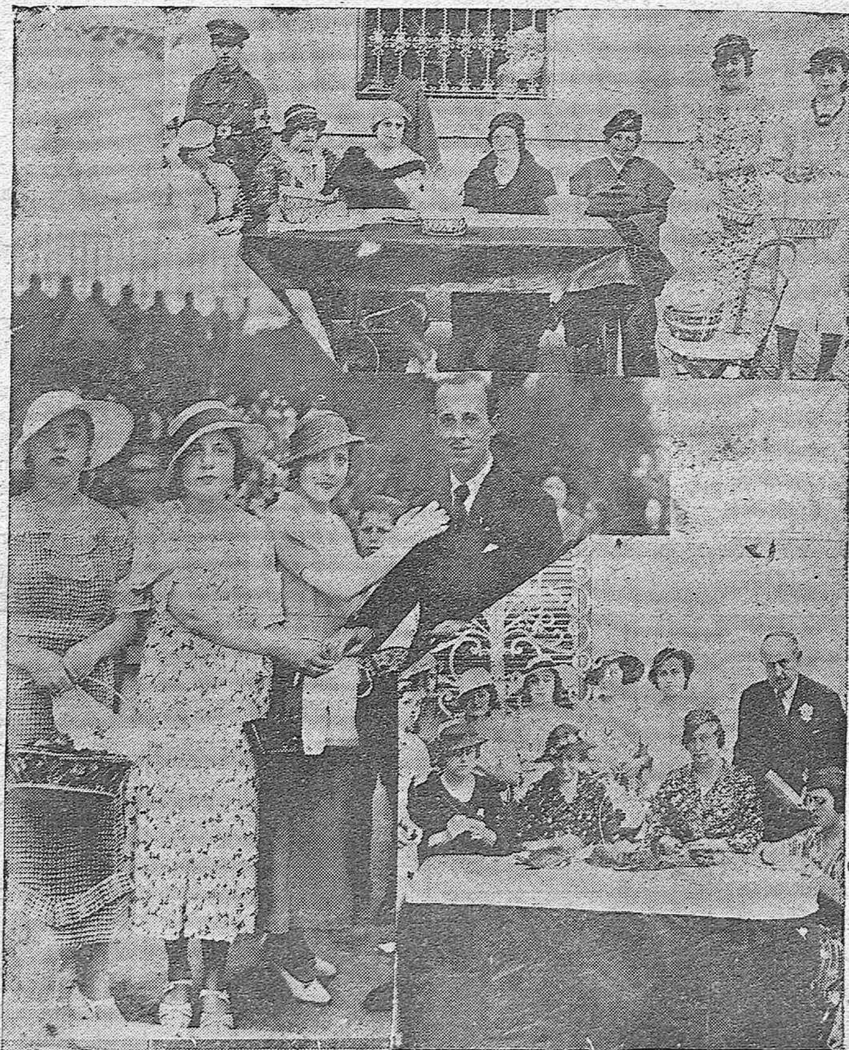
LA FIESTA DE LA FLOR. — Dos mesas presididas por distinguidas damas y bellas señoritas. Tres lindas postulantes.