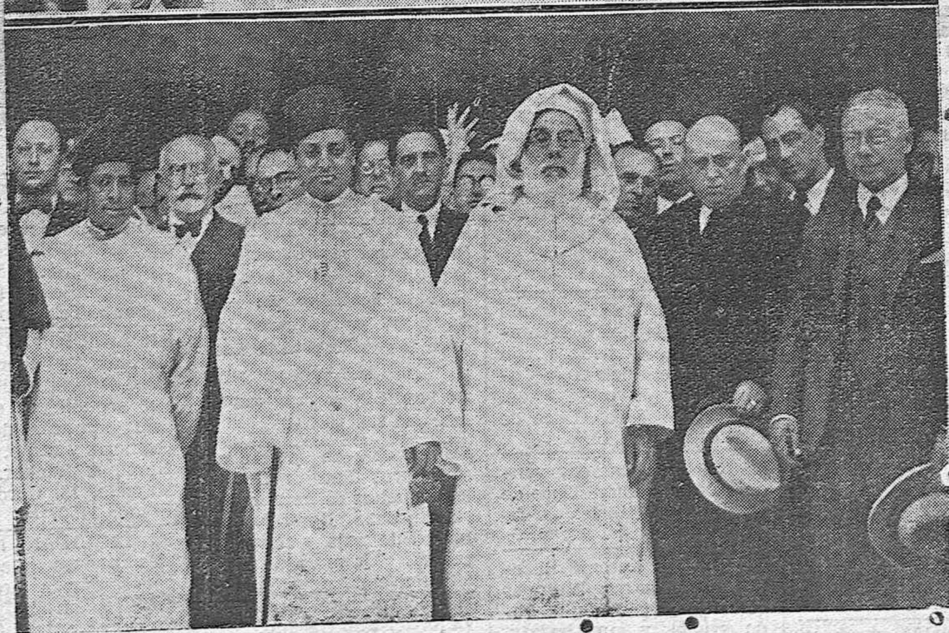
LA ESTANCIA DEL JALIFA EN CORDOBA.—S. A. L. el Jalifa Muley Hassan Ben-el-Mehedi Ben Ismael rodeado de numeroso público que le tributó una cariñosa manifestación de simpatía a su salida después de visitar nuestra incomparable Mezquita.—El Jalifa con todo su séquito, pasa en la puerta del Perdón para nuestro fotógrafo