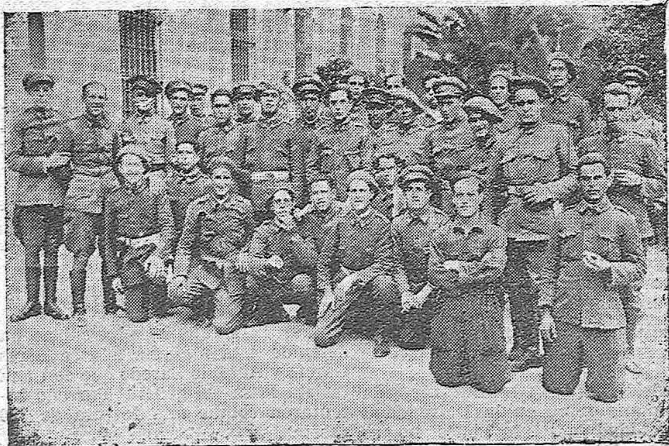
Grupos de artilleros que resultaron agraciados con el premio de la lotería que correspondió en el sorteo de ayer en Córdoba

SOMBRERO cordobés marca IBERIA el casco es sevillano hasta el hueso y en Córdoba le dá la salsa Padilla Crespo