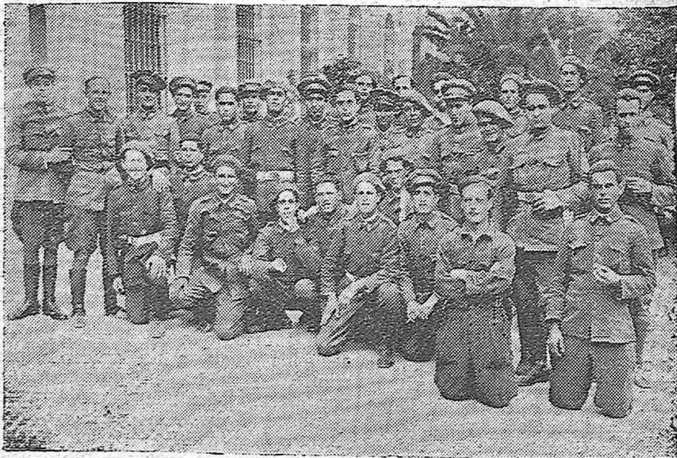
Grupos de artilleros que resultaron agraciados con el premio de la lotería que correspondió en el sorteo de ayer en Córdoba

SOMBRERO cordobés marca IBERIA el casco es sevillano hasta el hueso y en Córdoba le dá la salsa Padilla Crespo