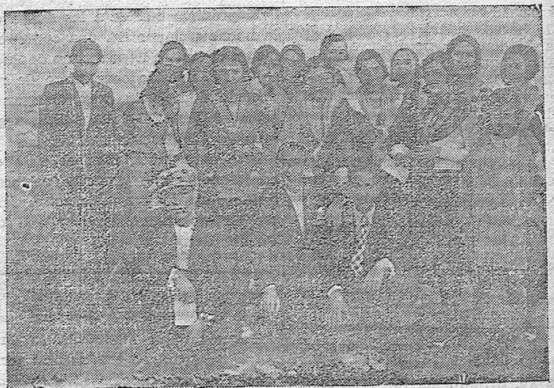
BELALCAZAR.—Grupo de jóvenes que con motivo de una festividad local organizaron una excursión a las afueras de la población de la Sierra