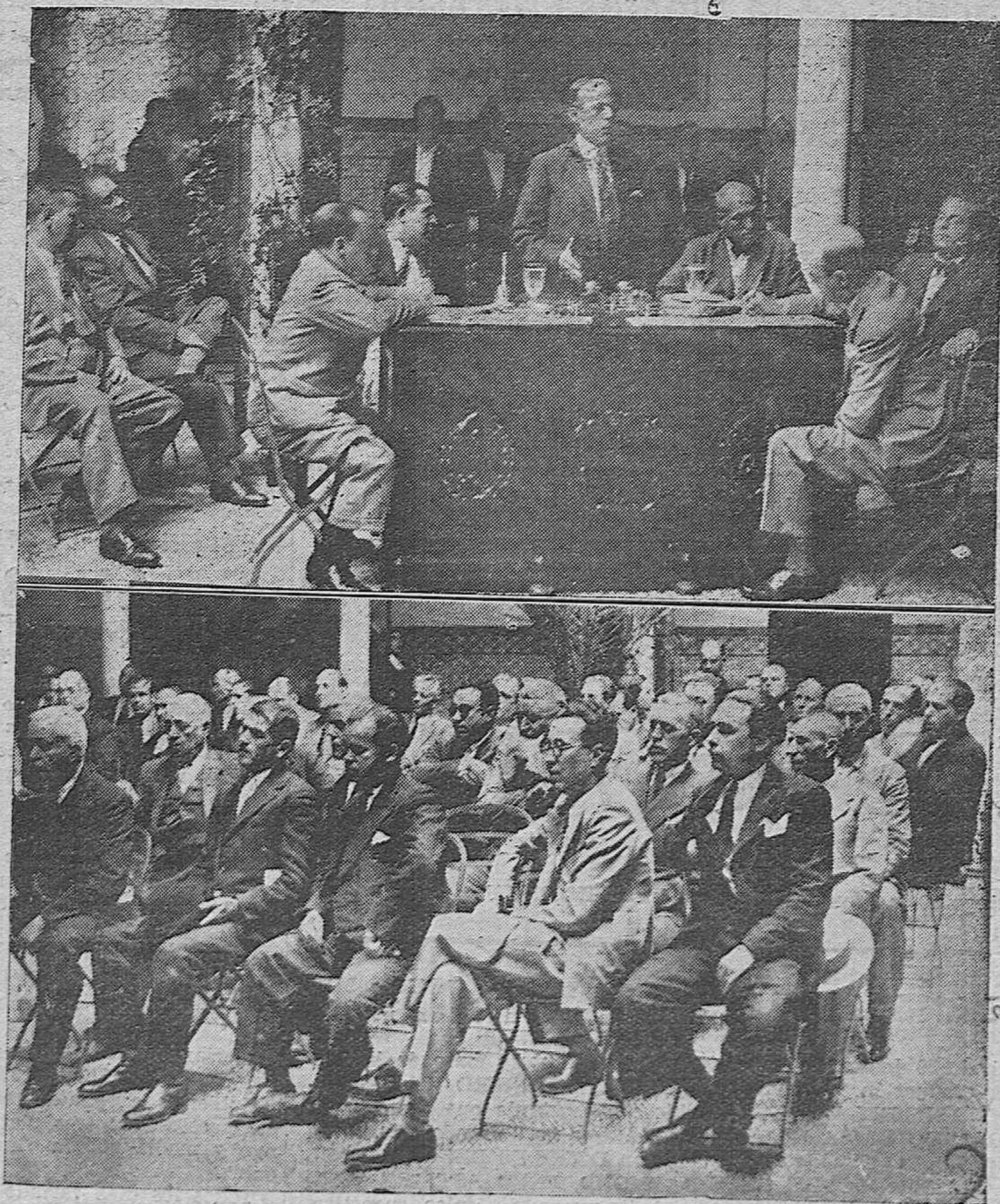
Arriba: Presidencia de la Asamblea Provincial de Alcaldes de la provincia celebrada hoy en la Diputación. El alcalde de Córdoba durante su discurso. Abajo: Una vista lateral de la Asamblea.