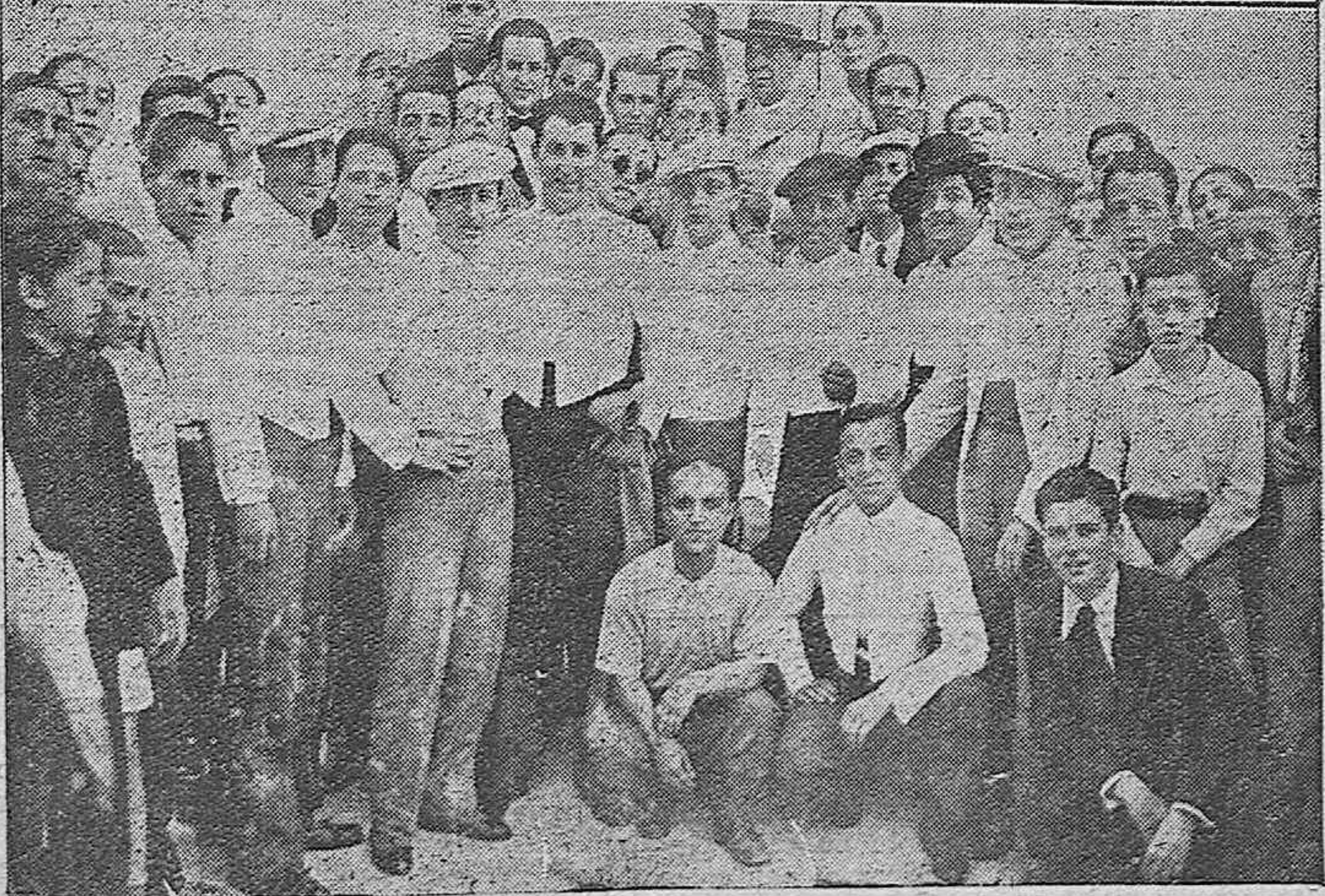
FESTIVAL BENEFICO. —En la Plaza de Toros de Córdoba se celebró el domingo 16 de Junio un festival de caracter benéfico. Señoritas que presidieron el festival citado.—Grupo de jóvenes cordobeses que tomaron parte en el festival taurino