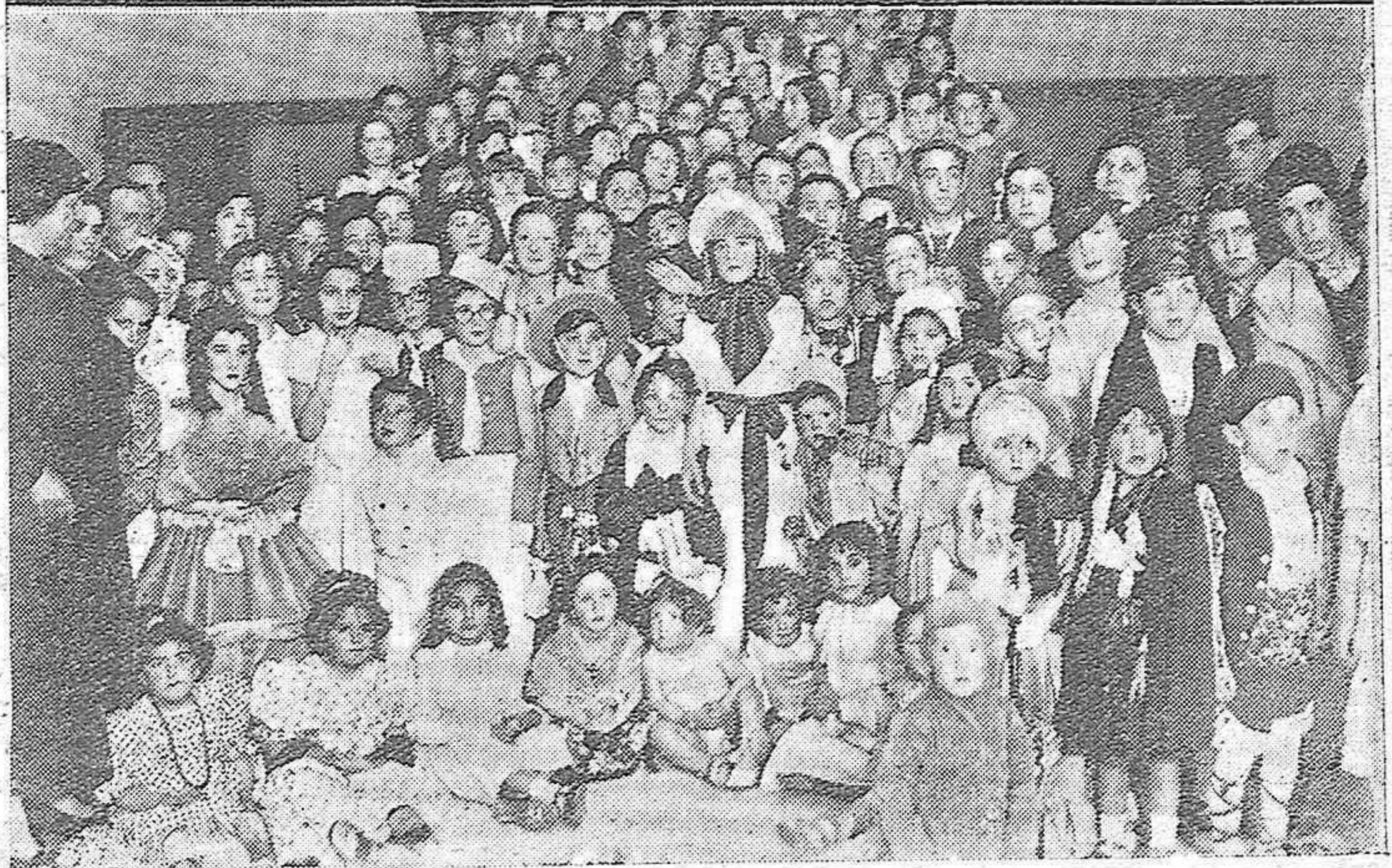
Arriba: Niños con bonitos disfraces que asistieron al concurso infantil en el Centro Filarmónico "Eduardo Lucena".—Abajo: Festival infantil celebrado en el Círculo de la Amistad.