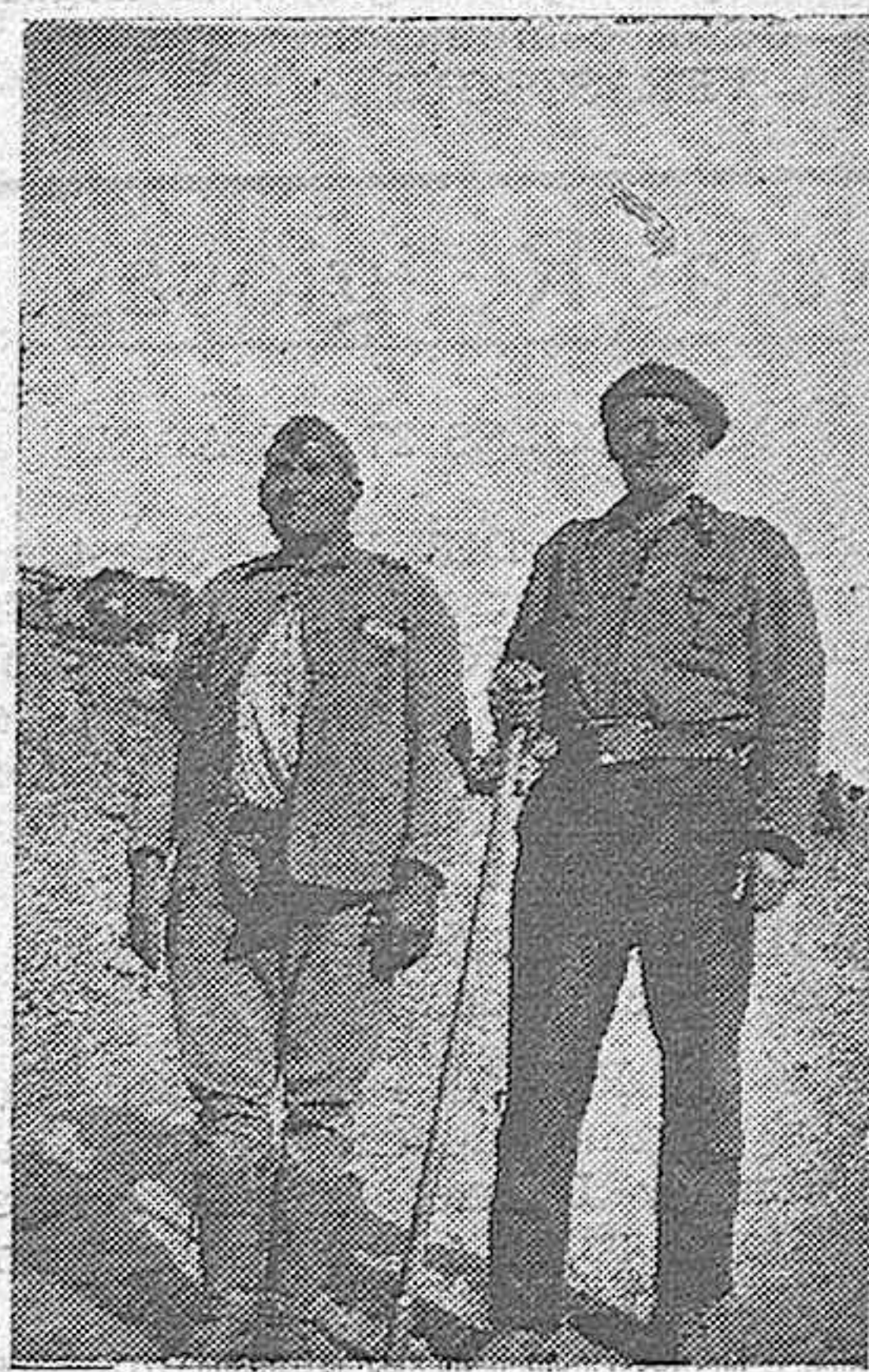
CINCUENTA Y TRES AÑOS

¡Voluntarios! Eso sois simplemente ahora y más que nunca. ¡Sois en vuestro anónimo, magníficos y dignos de todo respeto y admiración.