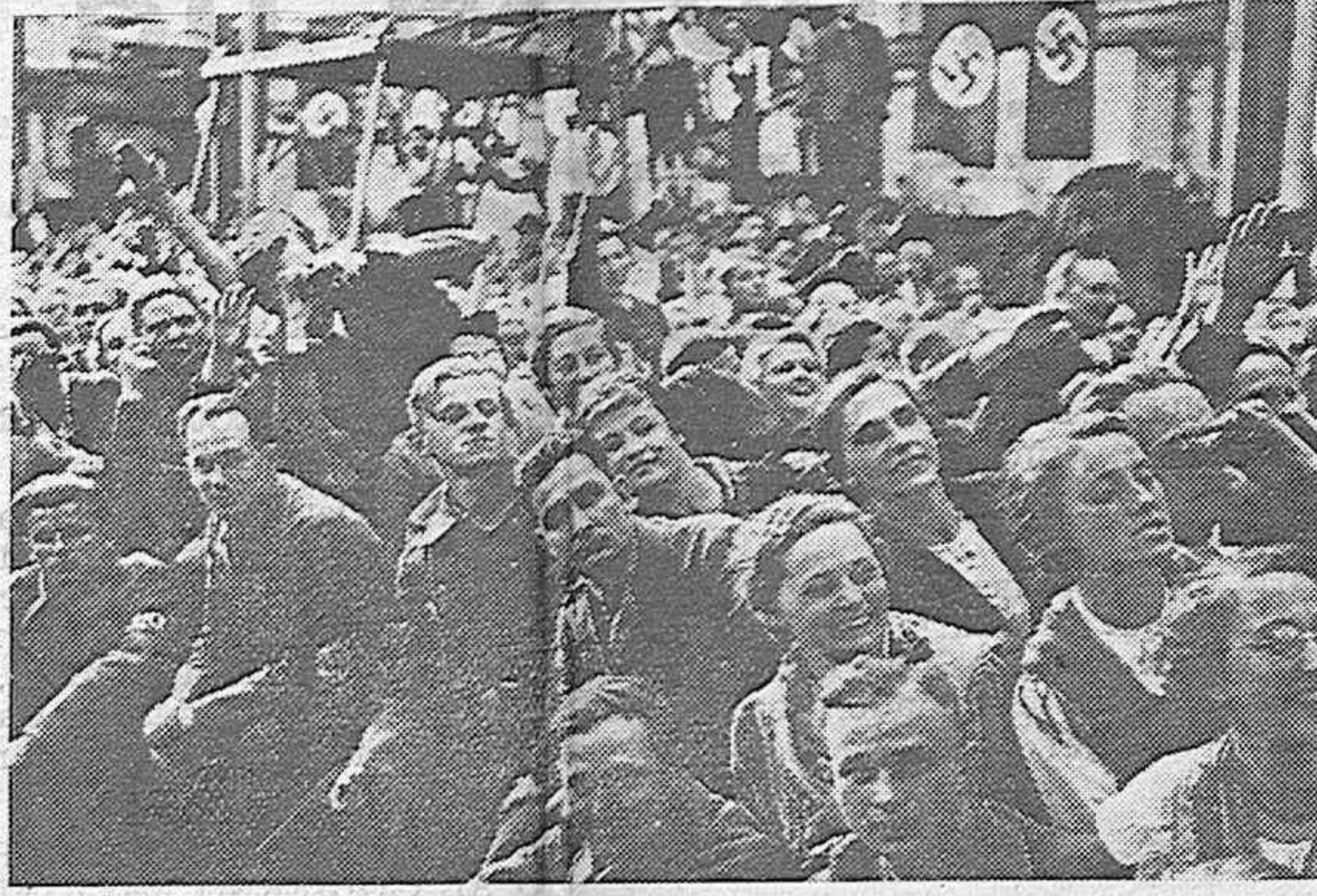
AUSTRIA.—Desde largos años la fabricación de vagones, en la fábrica de GRAZ en la Austria alemana estaba paralizada a causa de falta de trabajo. Muchísimo gravaba el paro forzoso sobre obreros. Ahora van a recomenzar el trabajo en esta empresa. He aquí en la foto, un sector de los oyentes, durante el discurso del Führer que fue interrumpido por aplausos frenéticos, como siempre.