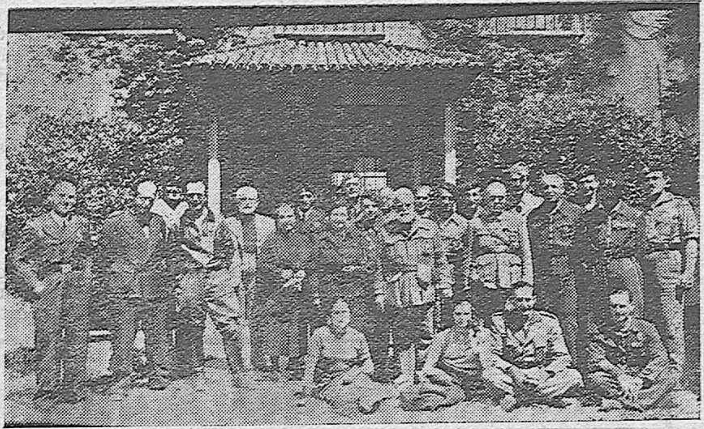
El general Cabanellas, sus familiares y las autoridades cordobesas, en la visita que hizo el domingo a nuestra población.