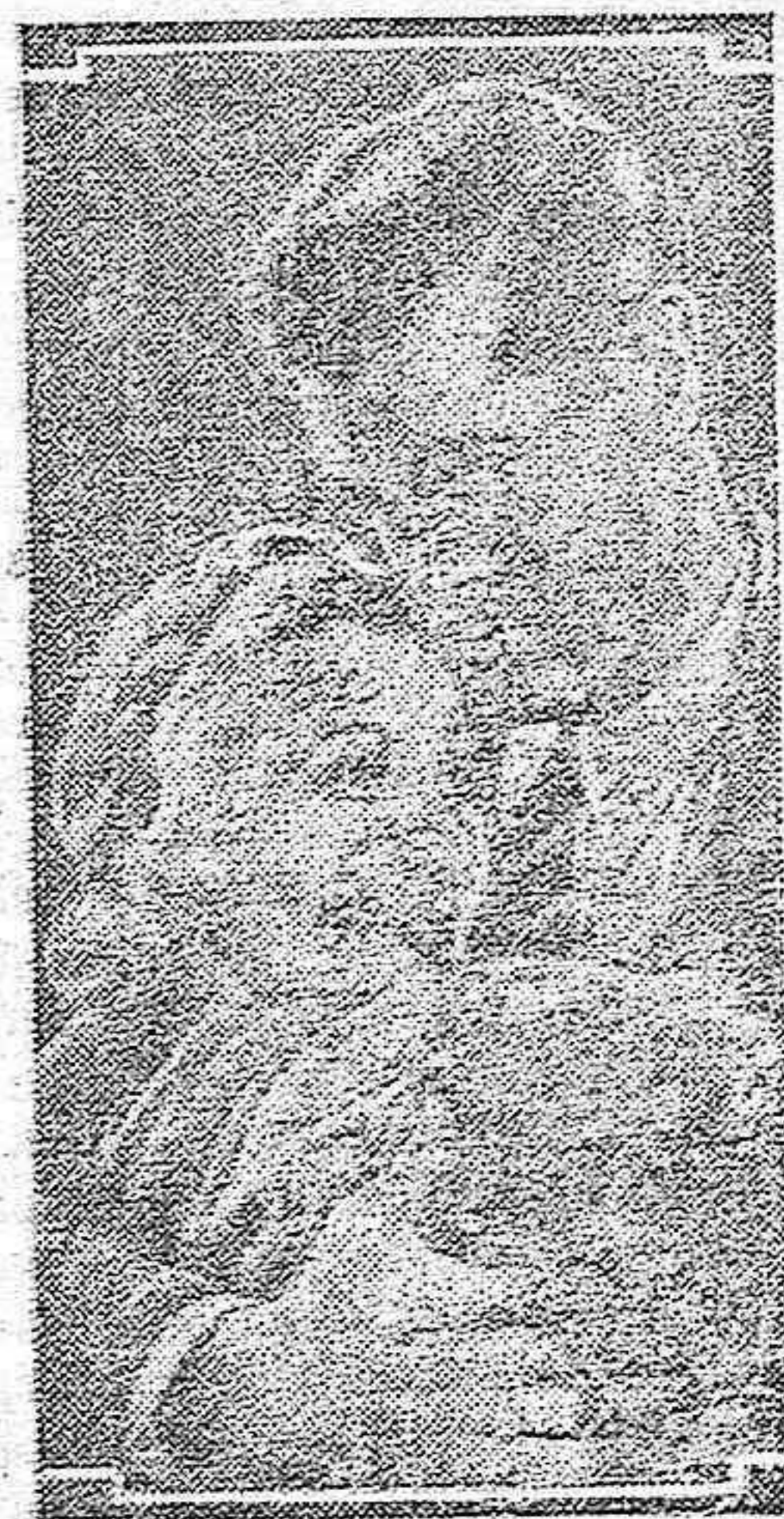
Una escena de la película "Cita a ciegas".

"Es mi hombre" es otro film más que Cifesa presentará por toda España menos por Cataluña y que llevará al extranjero con la seguridad de lograr con él otro triunfo más a su ya larga cadena de éxitos.