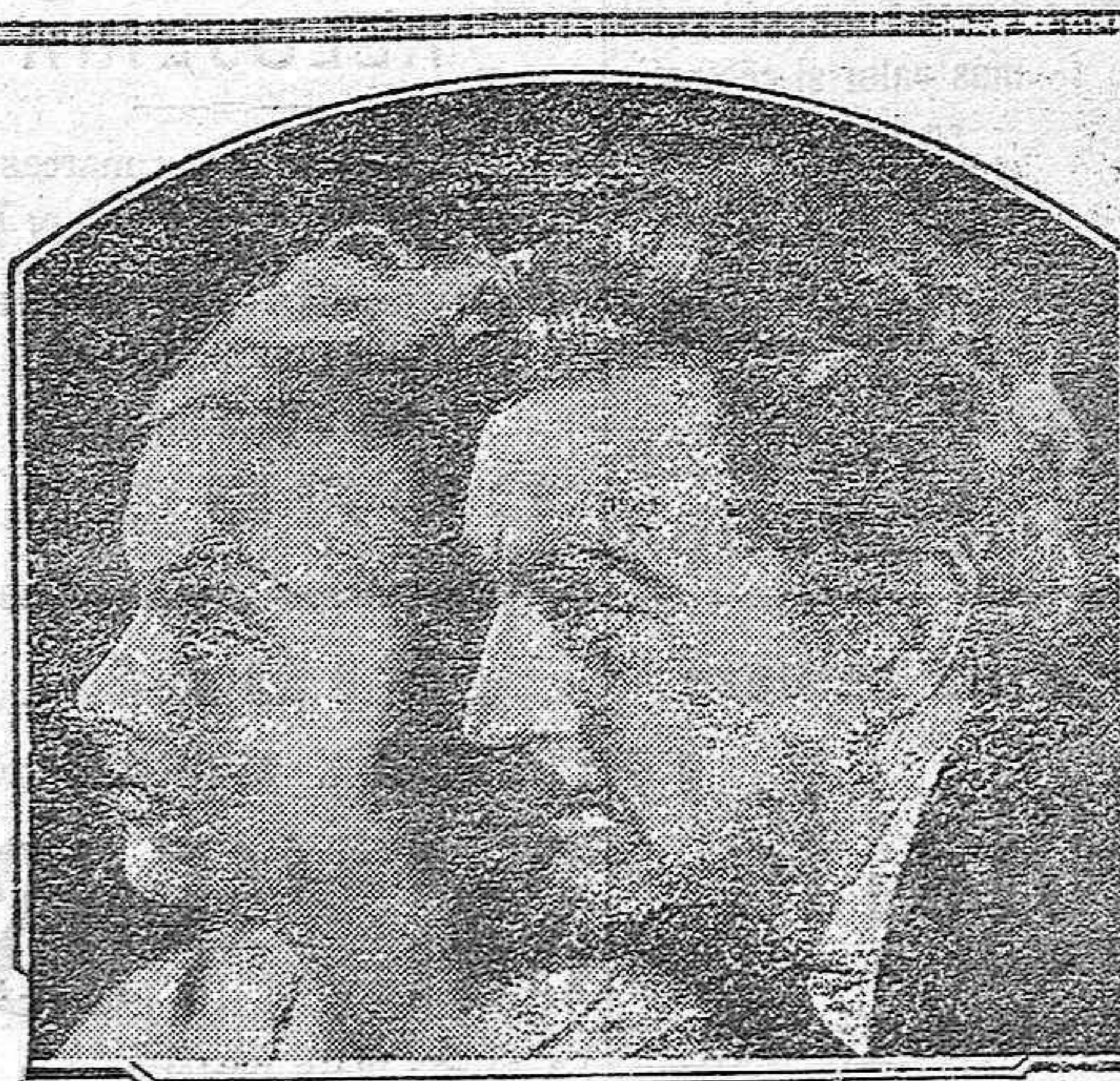
Carole Lombart y John Barrymore en un primer plano del film Cifesa, "La comedia de la Vida" :: :: :: :: ::