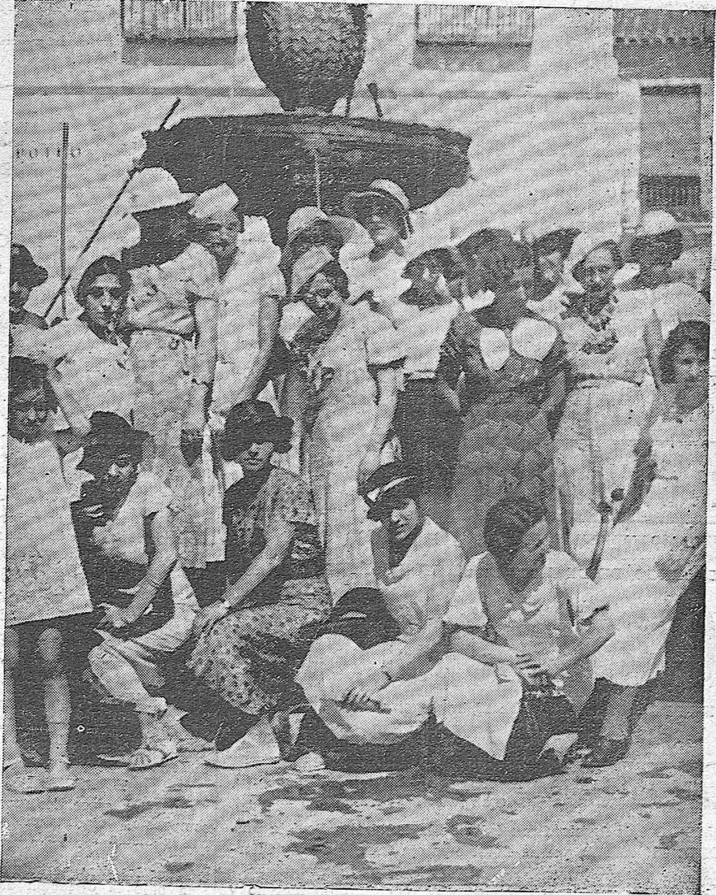
Profesoras francesas que visitaron ayer nuestra capital en viaje de estudios.