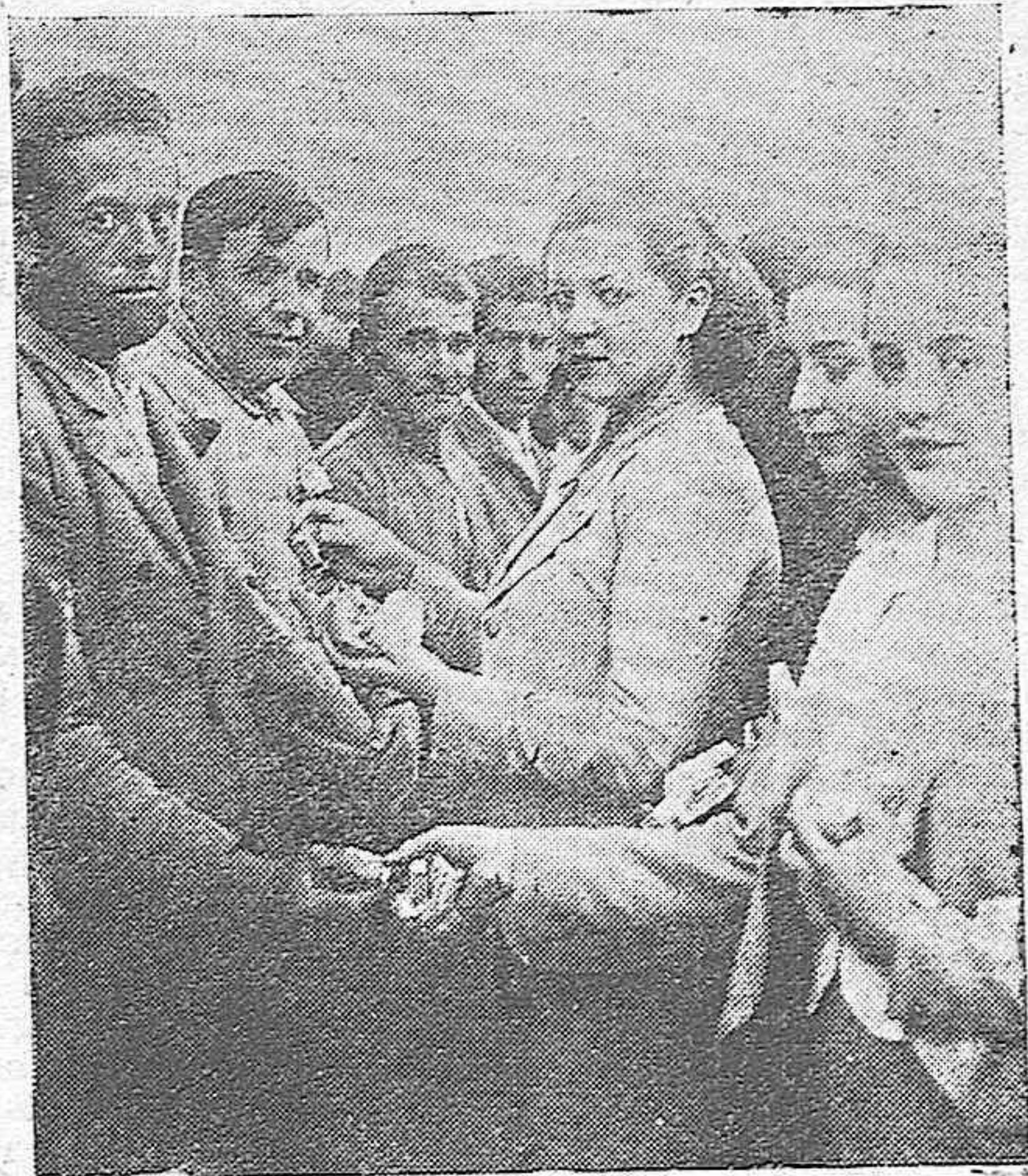
Nuestras camaradas de la Sección Femenina, obsequian a los reclusos de la Prisión Provincial de Córdoba, durante la visita hecha a los presos por la Falange

En Almodóvar del Río el menú de Nochebuena fué: Sopa con menudillos de aves, pepitoria, bistechs de lomo con patatas, frutas, dulces, vinos y anís. De esta cena, disfrutaron no sólo los niños que diariamente asisten al Comedor sino también las personas humildes de la localidad, distribuyendo nuestras camaradas las raciones por los domicilios de aquellos que por enfermedad o por cualquier otra circunstancia no pudieron ir a recogerla. Durante la comida la rondalla de flechas tocó y cantó preciosos villancicos.