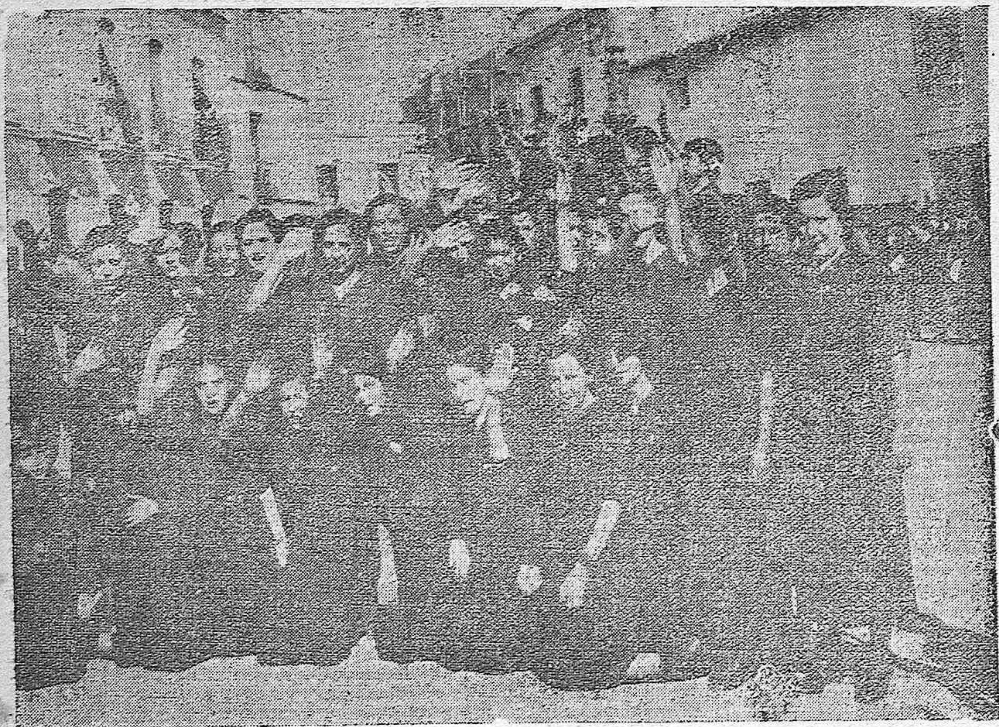
Sección femenina de Falange Española de Posadas.