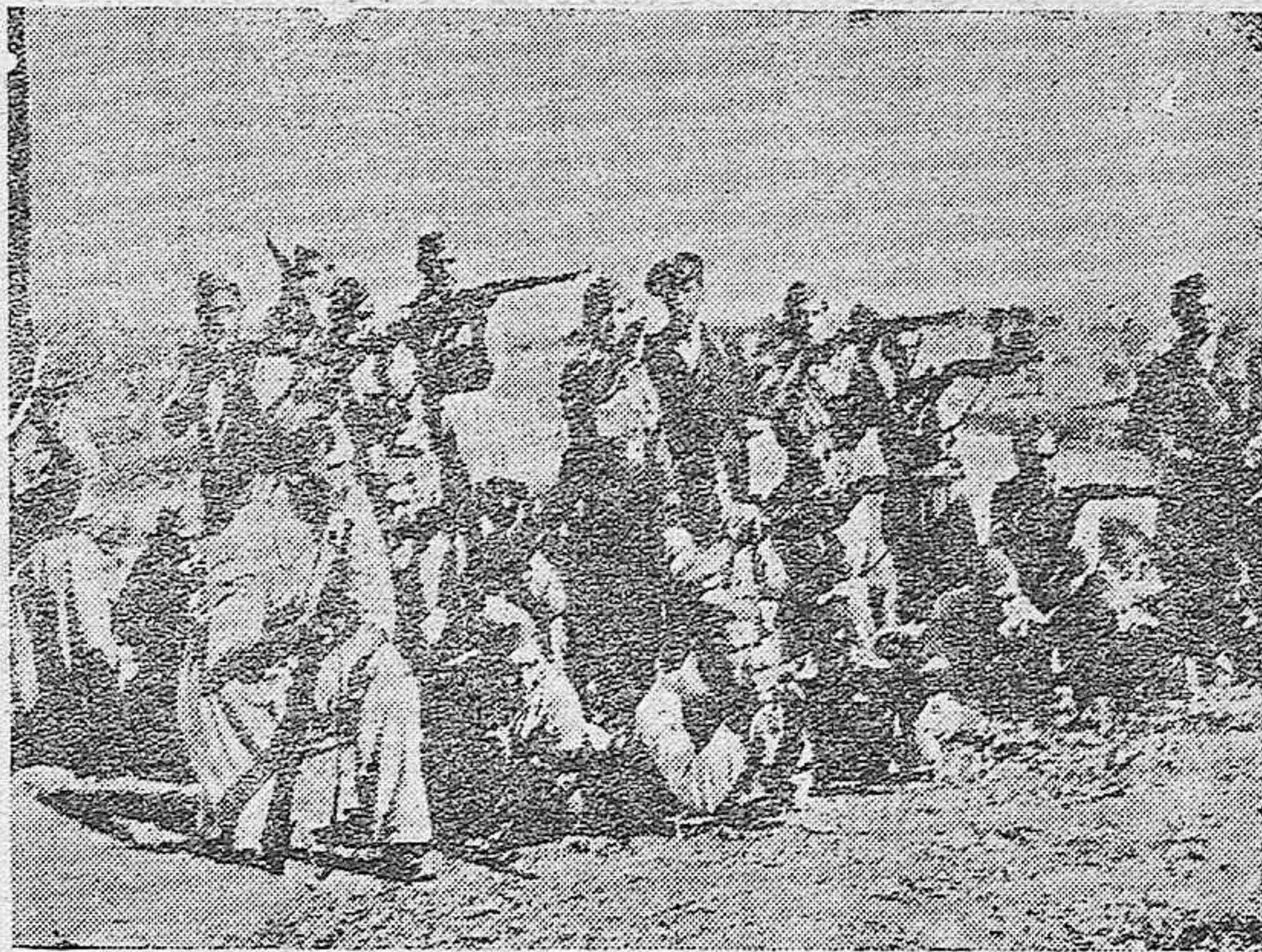
Nuestros camaradas de Falange, en las avanzadas.