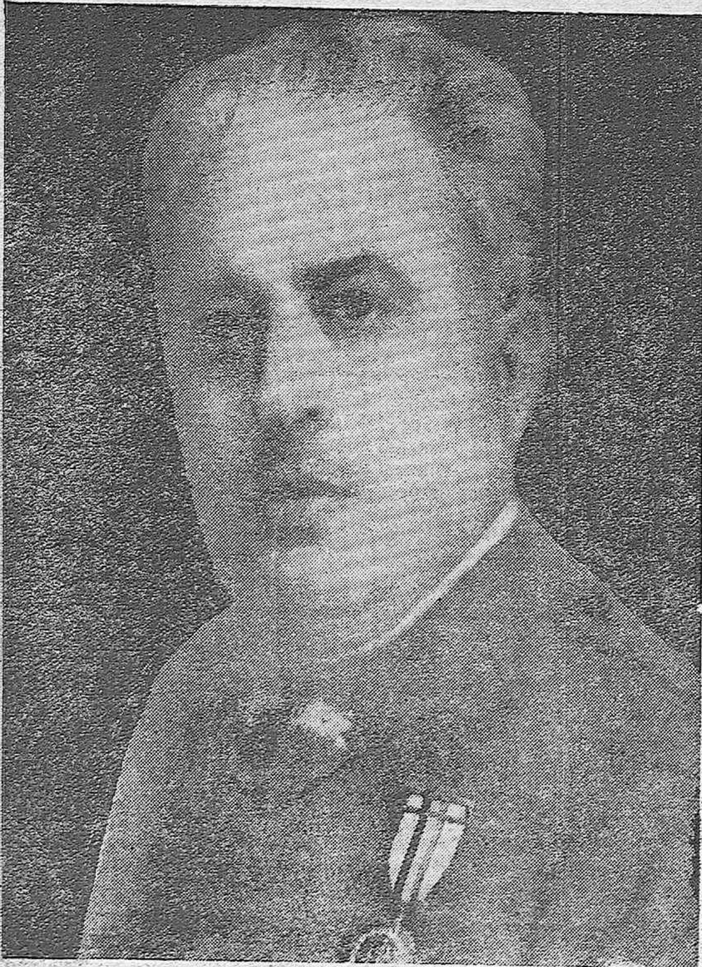
EL CORONEL YAGÜE, HEROICO JEFE DE LA LEGIÓN.