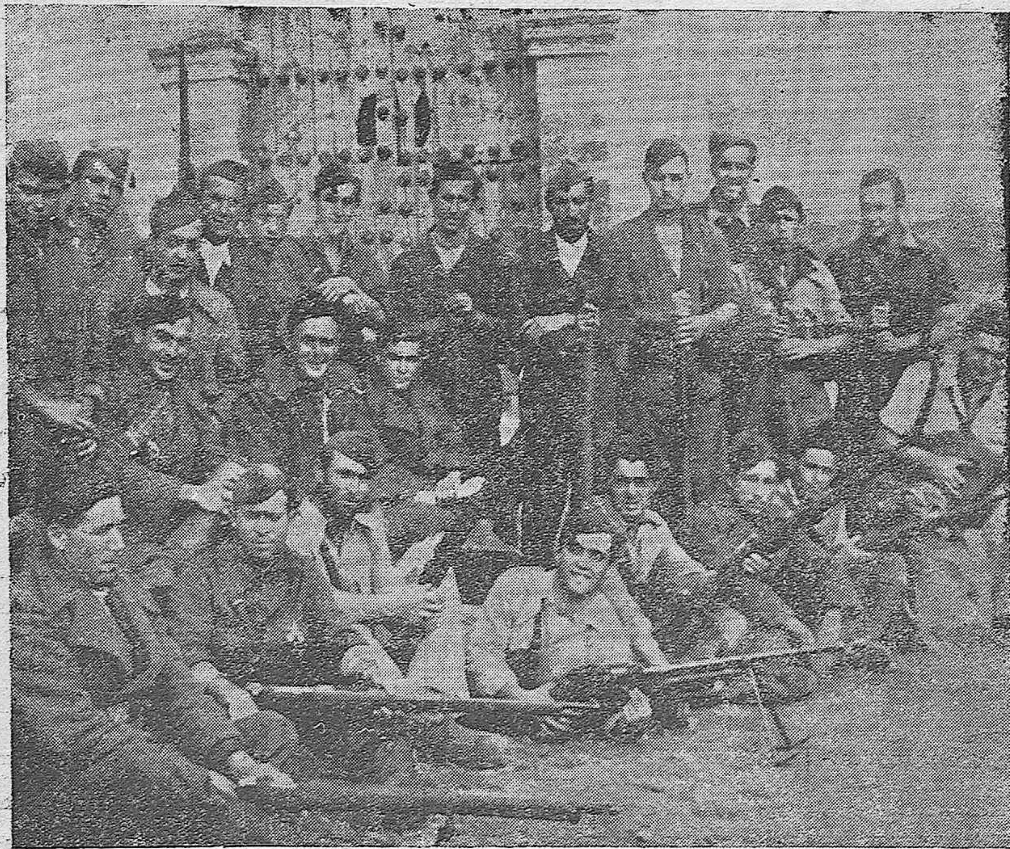
En un pueblo del frente, defendido por Falange, los camaradas pensando en España, esperan el momento de enfrentarse con los rojos.