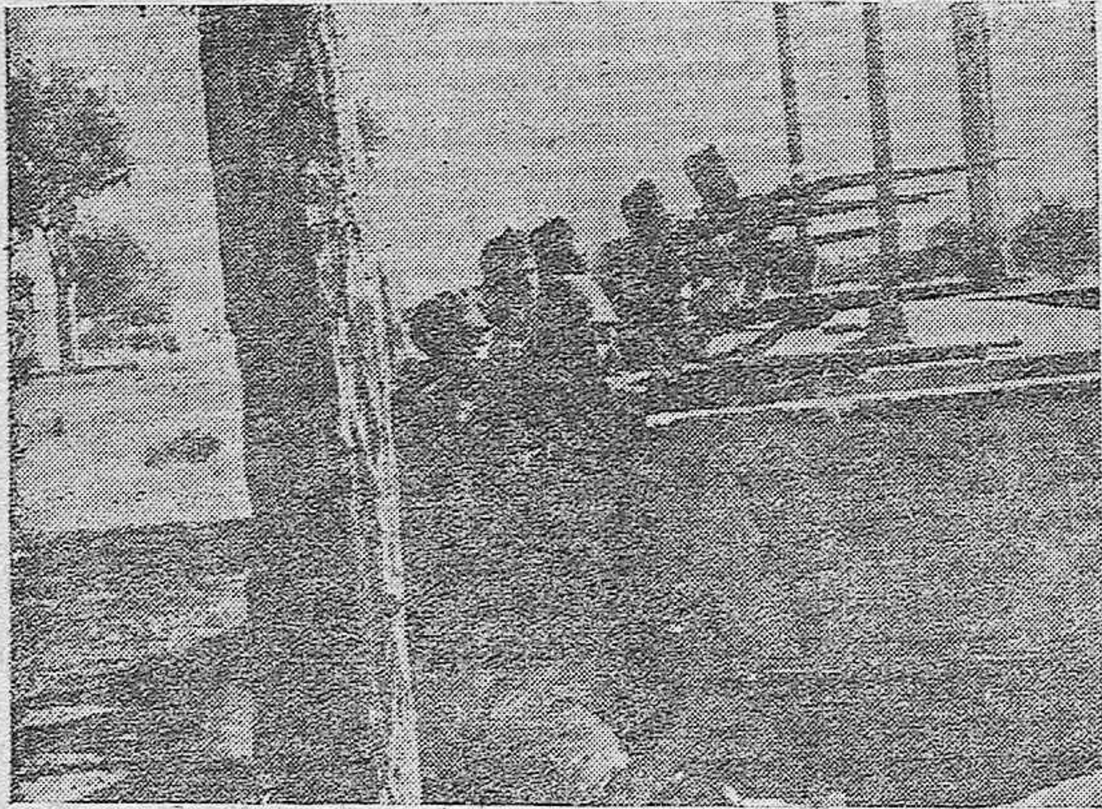
Frente a los rojos, nuestros soldados hacen fuego, esperando el momento de avanzar.