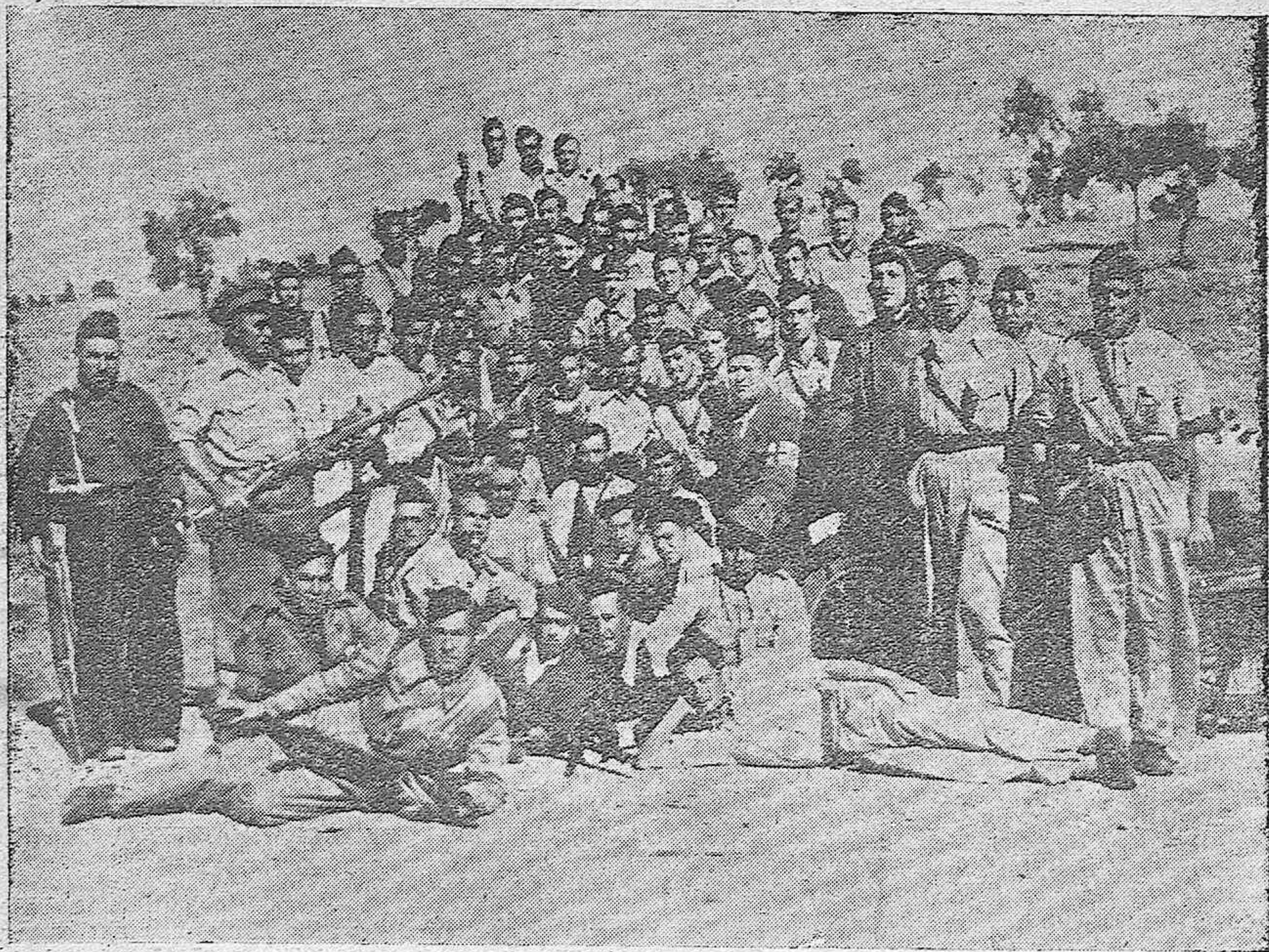
Los que luchan por España en los frentes. Los que a diario ponen a prueba su heroísmo.