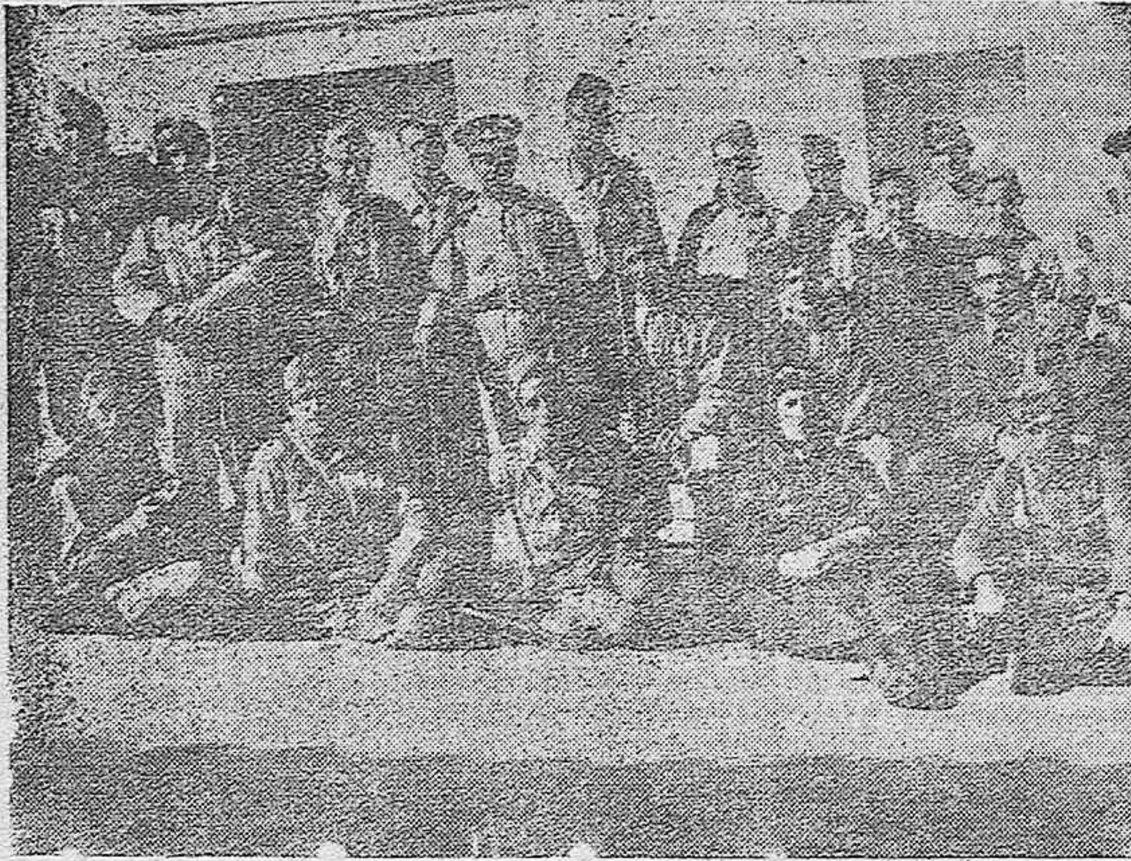
En el frente. Grupo de heroicos soldados del Ejército azul que lucha por España.