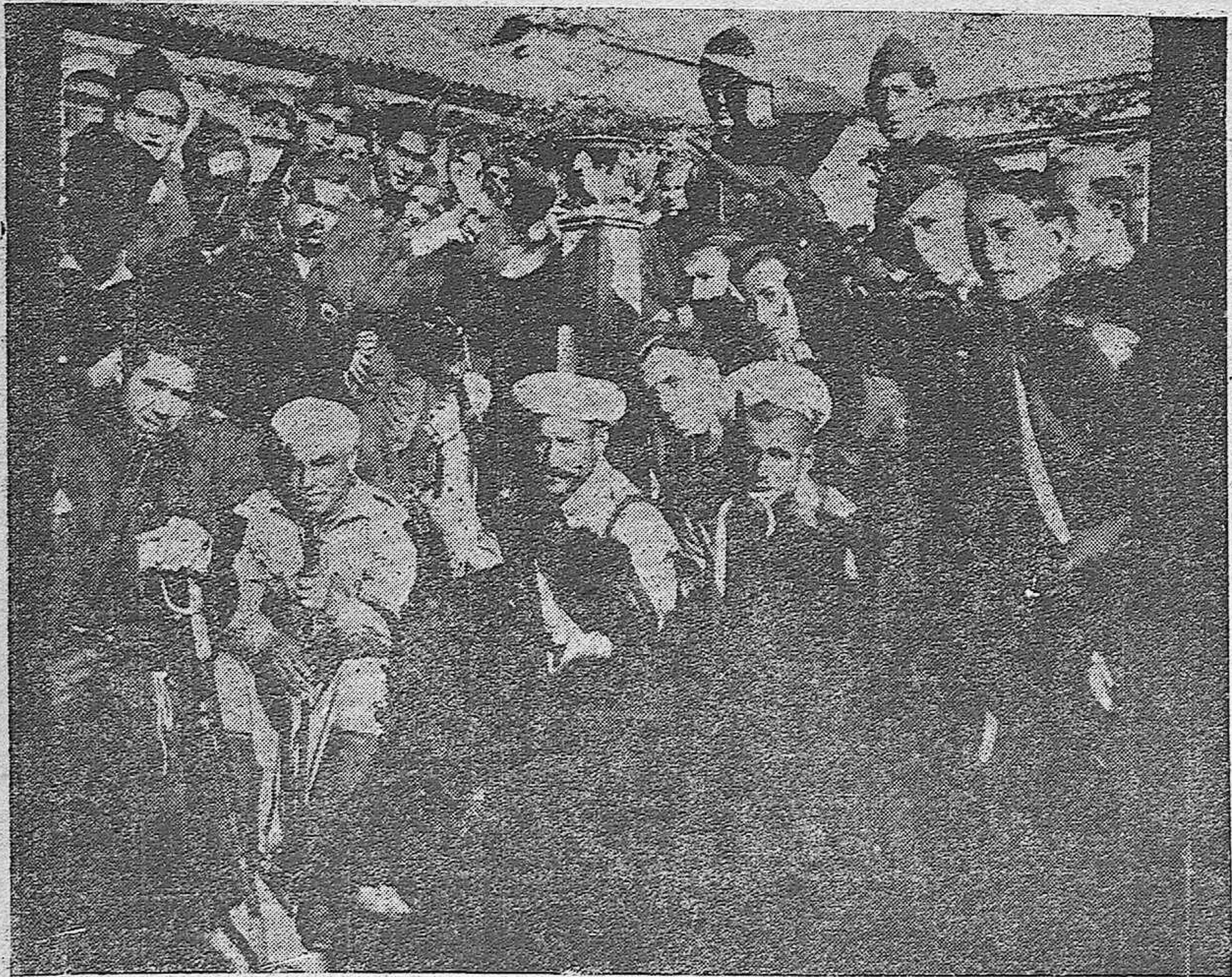
Grupo de Regulares y falangistas, que se distinguieron por su bravura en la toma de Pueblonuevo del Terrible.