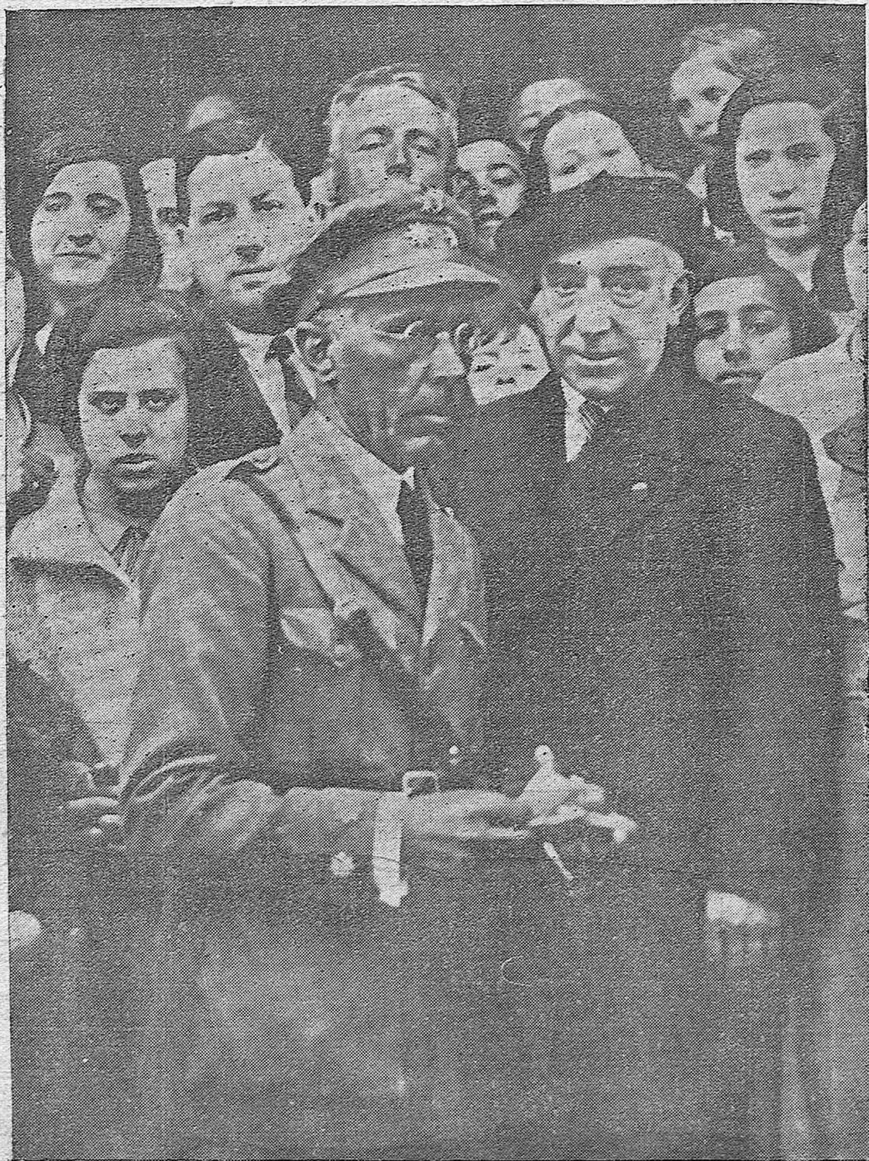
FOTOGRAFIAS HISTORICAS.—El teniente coronel Mangada al salir de la prision de Jaca, acompañado de don Pío Díaz, después de cumplir cuatro meses de condena en 1930, por sus ideas republicanas.