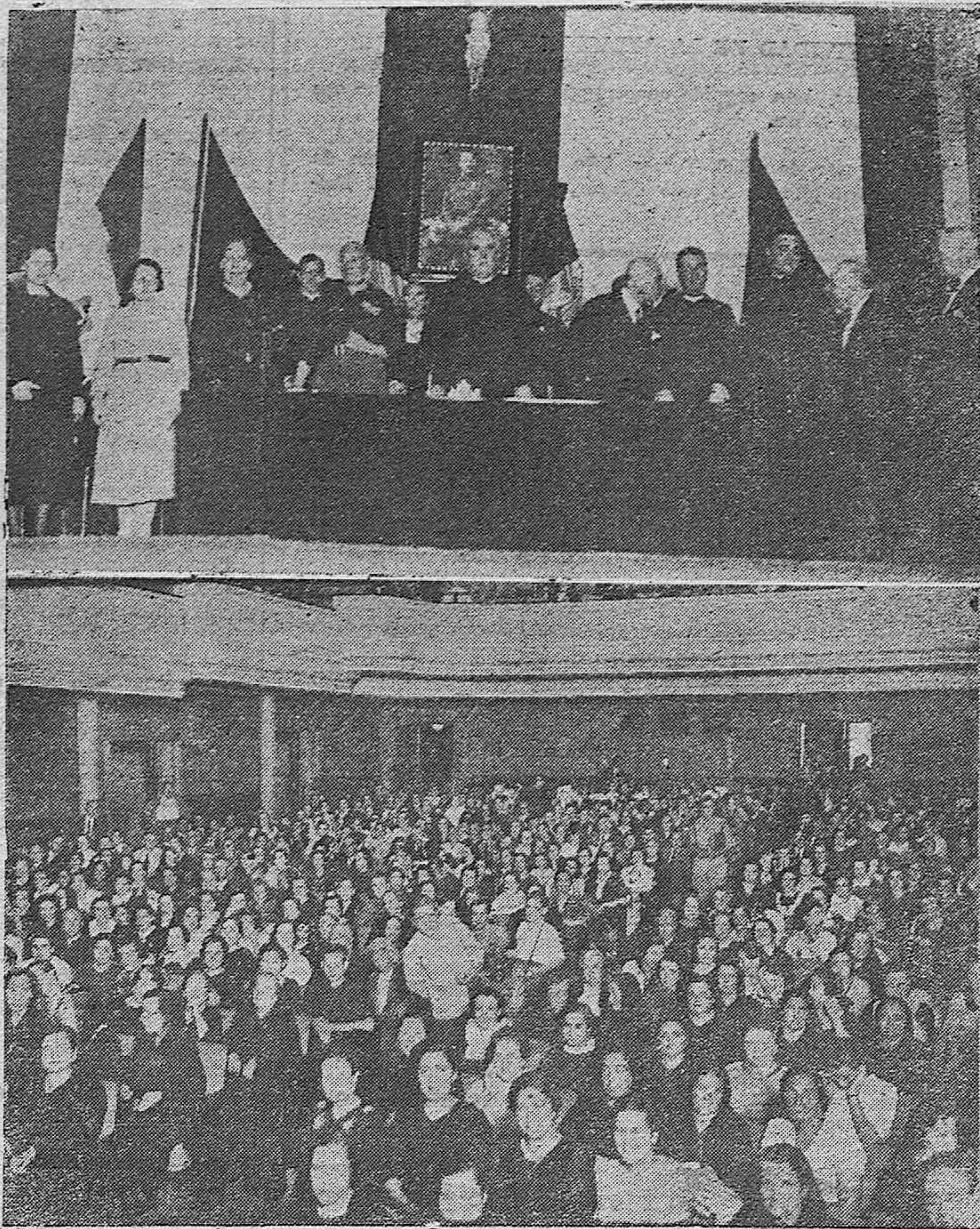
VELADA NECROLOGICA DE HOMENAJE AL MAESTRO CAIDO.—PRESIDENCIA DEL ACTO.—UN ASPECTO DEL LOCAL DEL GONGORA, DONDE SE CELEBRO EL MISMO

DIARIO DE FALANGE ESPAÑOLA TRADICIONALISTA Y DE LAS J. O. V. U.