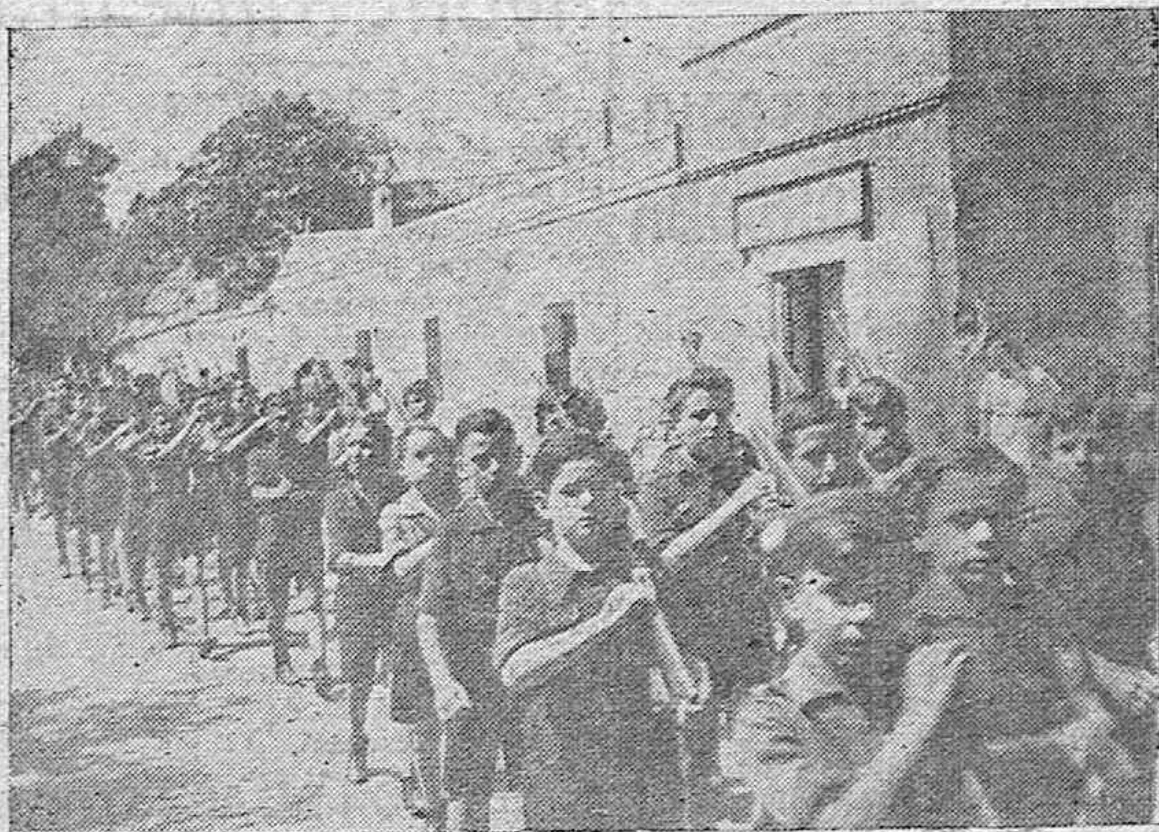
Los flechas desfilaron ante la Cruz de los Caídos de Córdoba, el 22 de Agosto, en el homenaje a las víctimas de la Cárcel Modelo de Madrid.