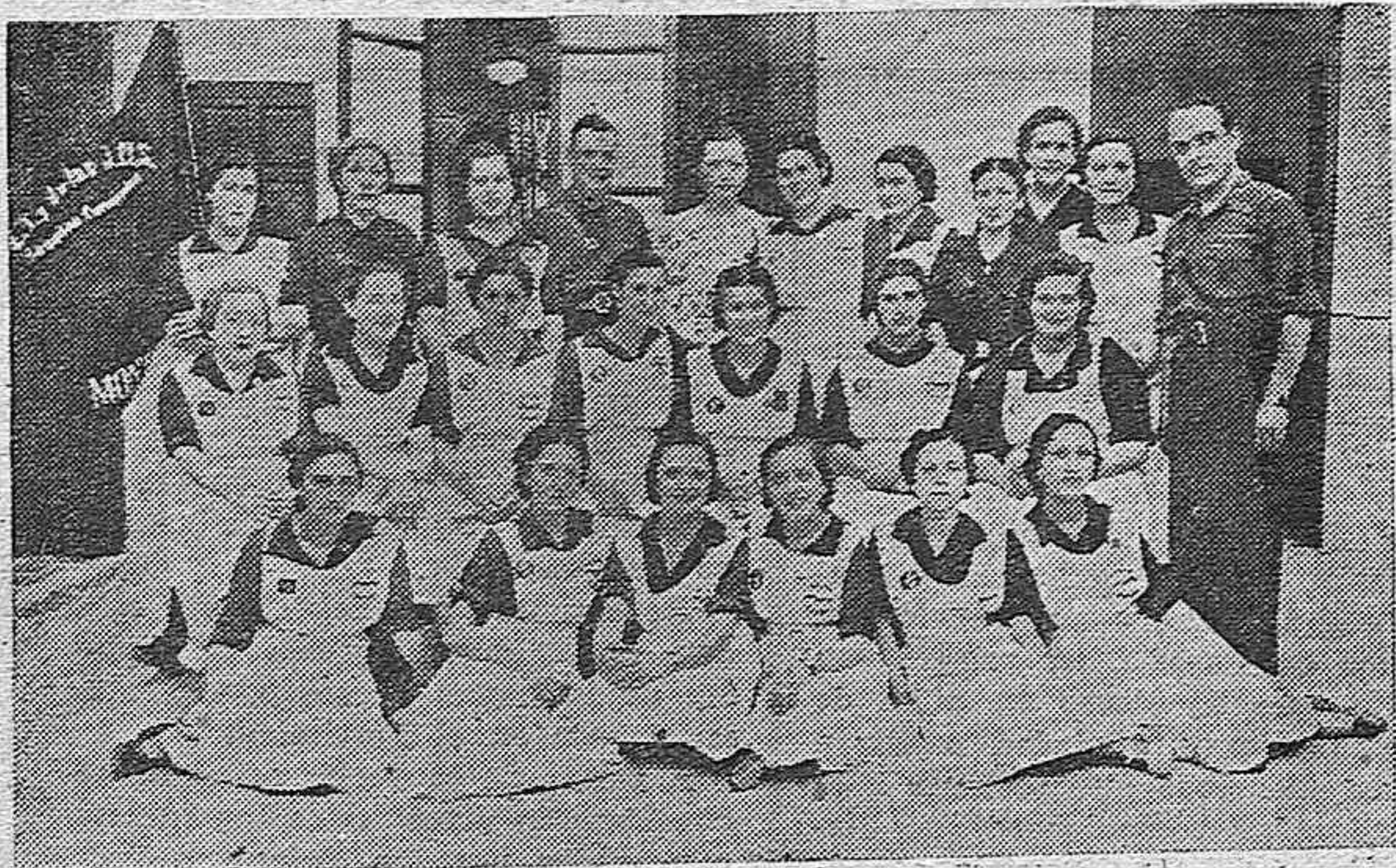
Nuestras camaradas de "Auxilio Social" que sirven en los comedores recién inaugurados de Monfilla.

SANTORAL DEL DIA. —Santos Eusebio, p.; Anastasio, ob.; Mirón, pb., Liberato, ab.; Bonifacio, dc.; Siervo, Rústico, Pablo, Juliana, mrs.; Clara de Montefalco, vg.; San Jacinto, O. P.; apóstol de Polonia (1257).