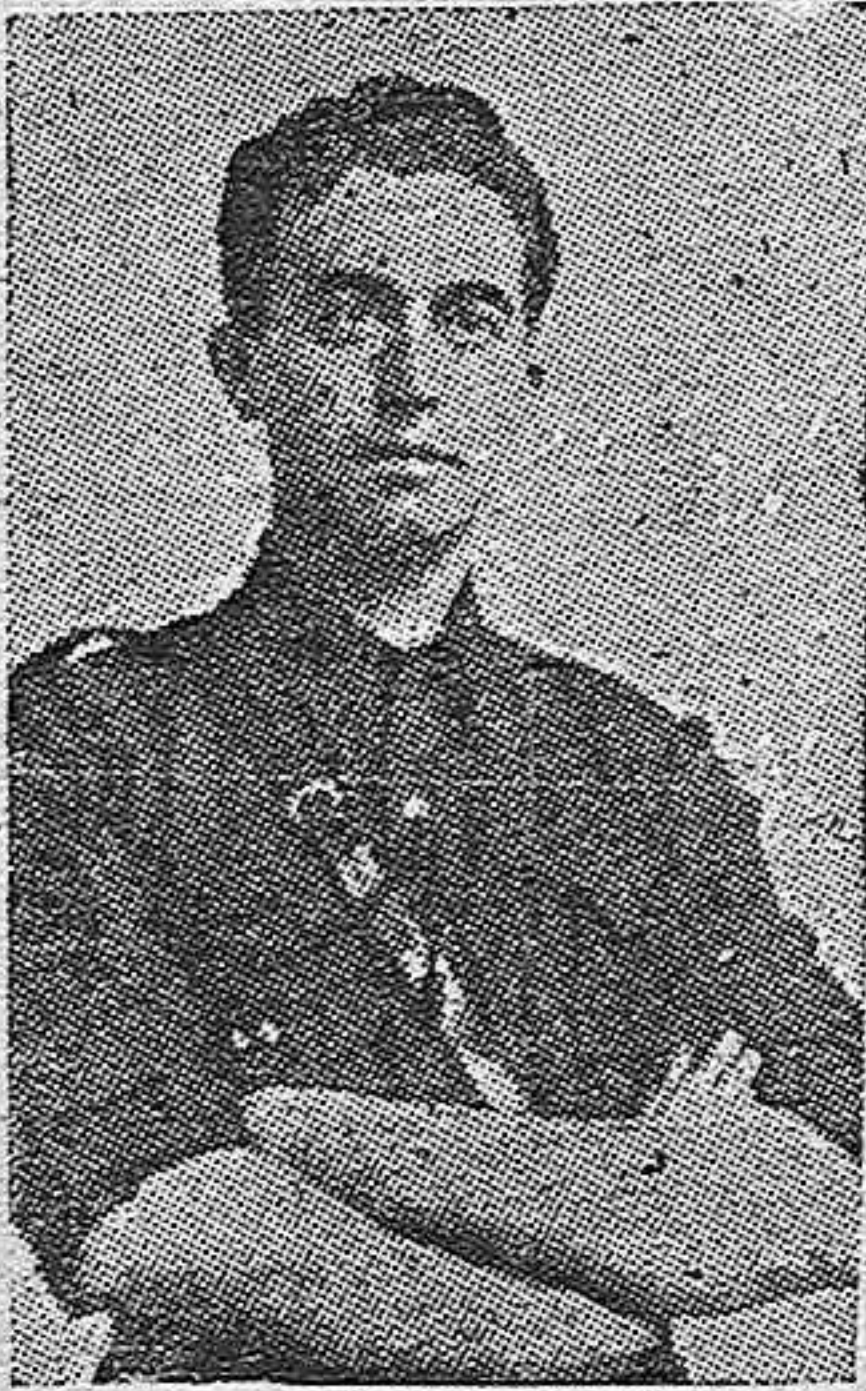
24 de Julio de 1936, Onésimo Redondo,

Bajo el plomo de las traidoras armas marxistas, en Labajo (Segovia), cayó el