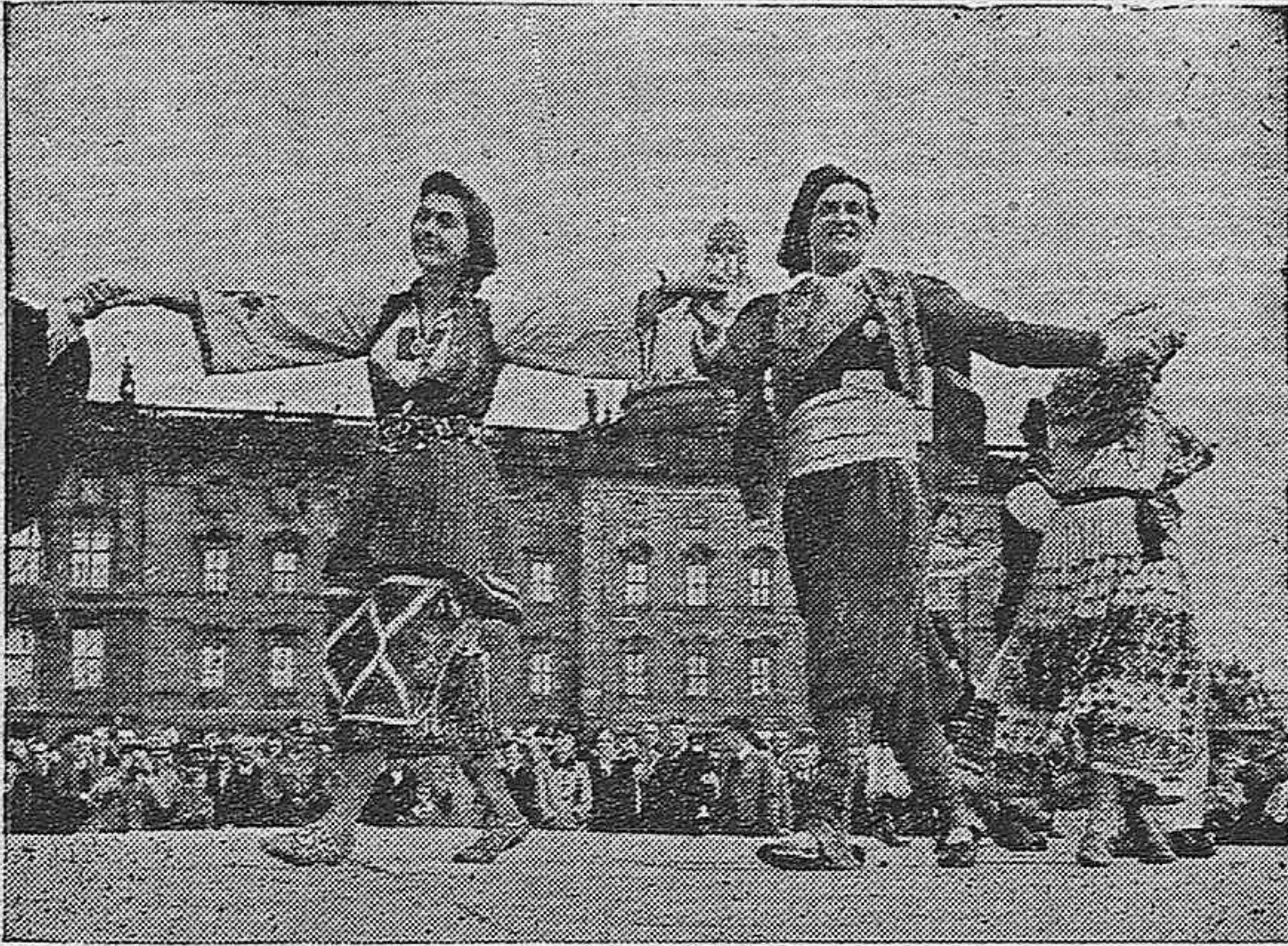
BERLIN.-Un grupo de baile yugoeslavo presenta en el "Lustgarten" sus danzas nacionales.