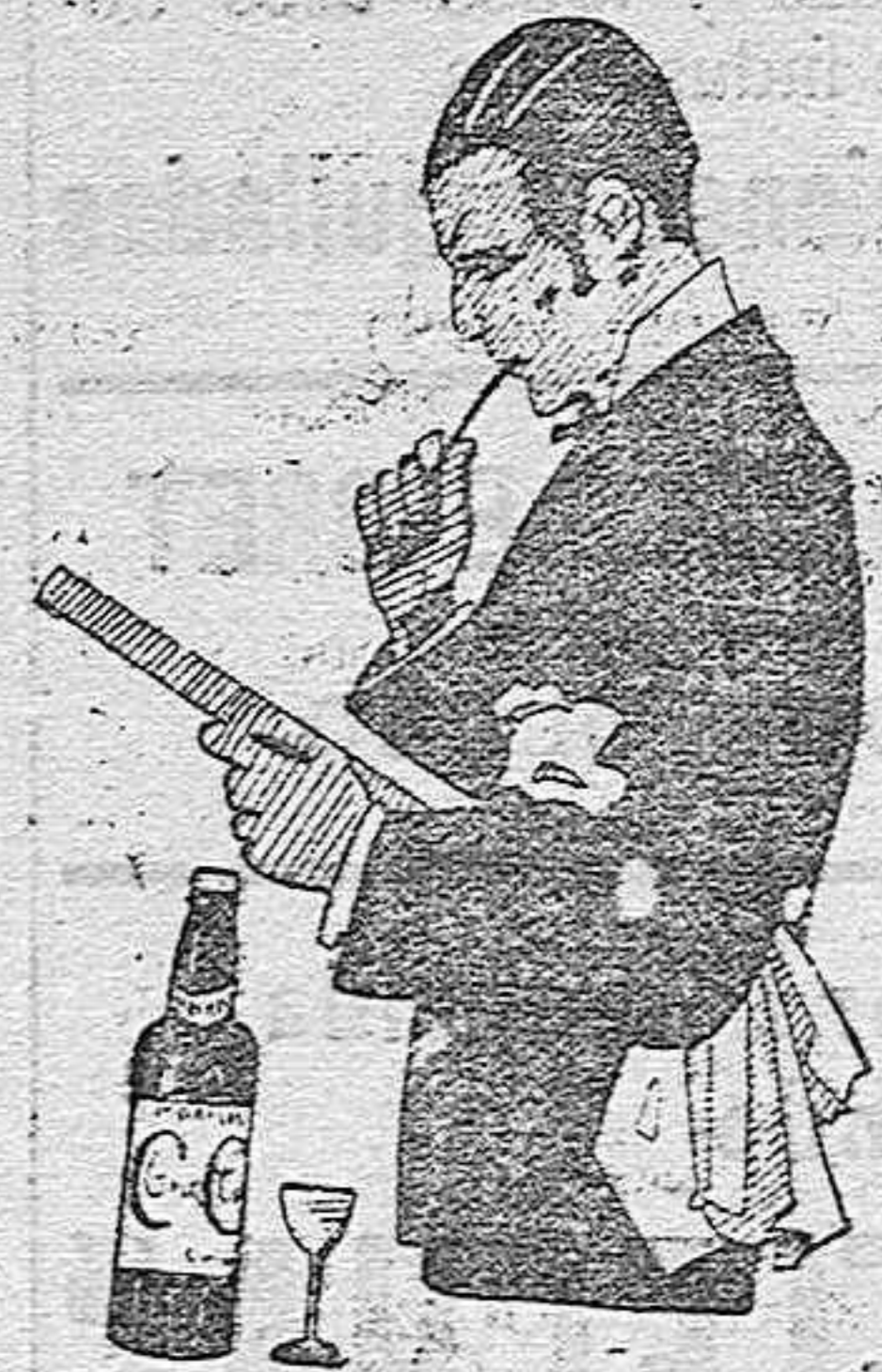
MONTILLA, siempre Cruz Conde