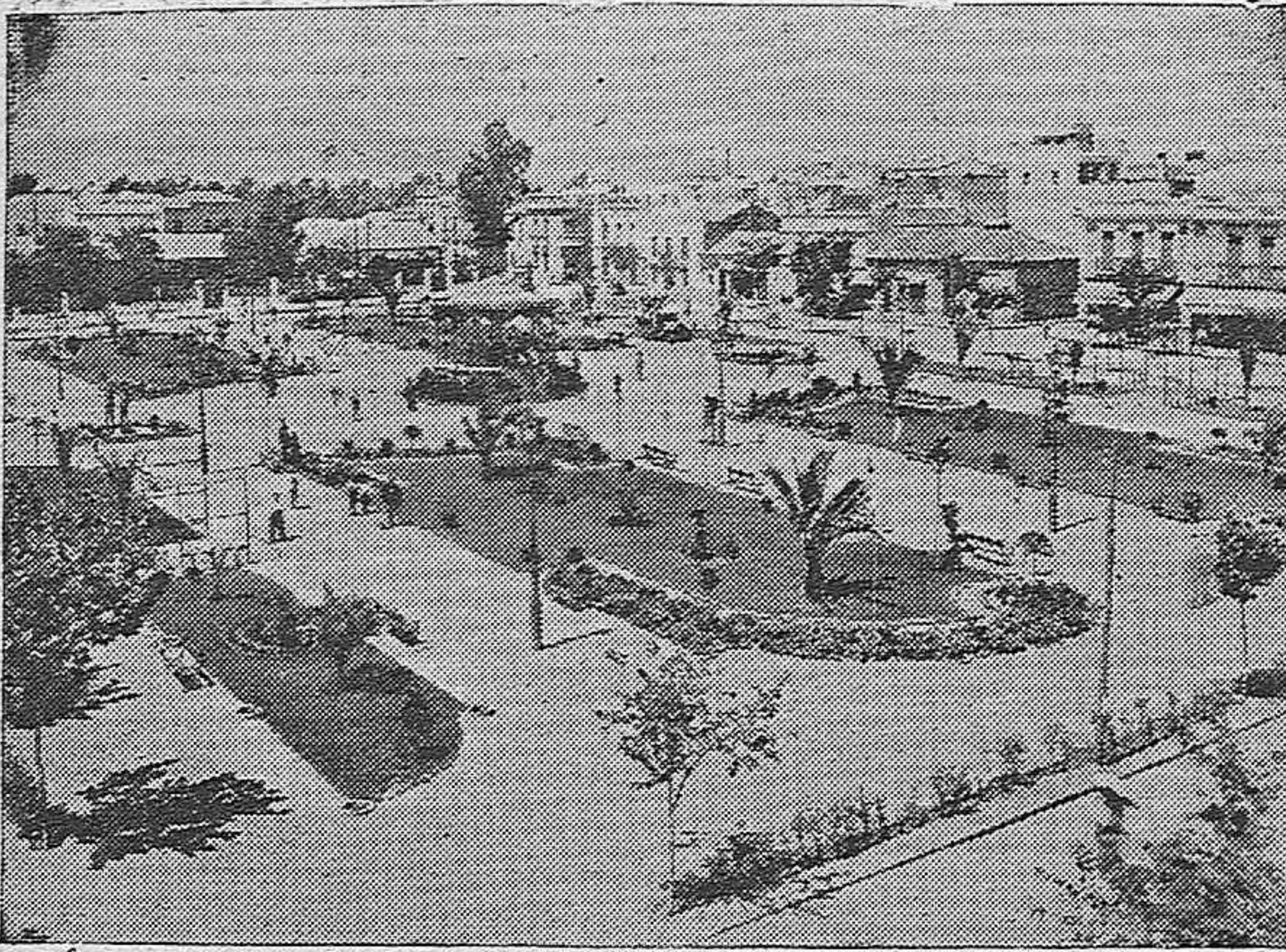
Hermoso Parque de Santa Bárbara de Peñarroya-Pueblonuevo.