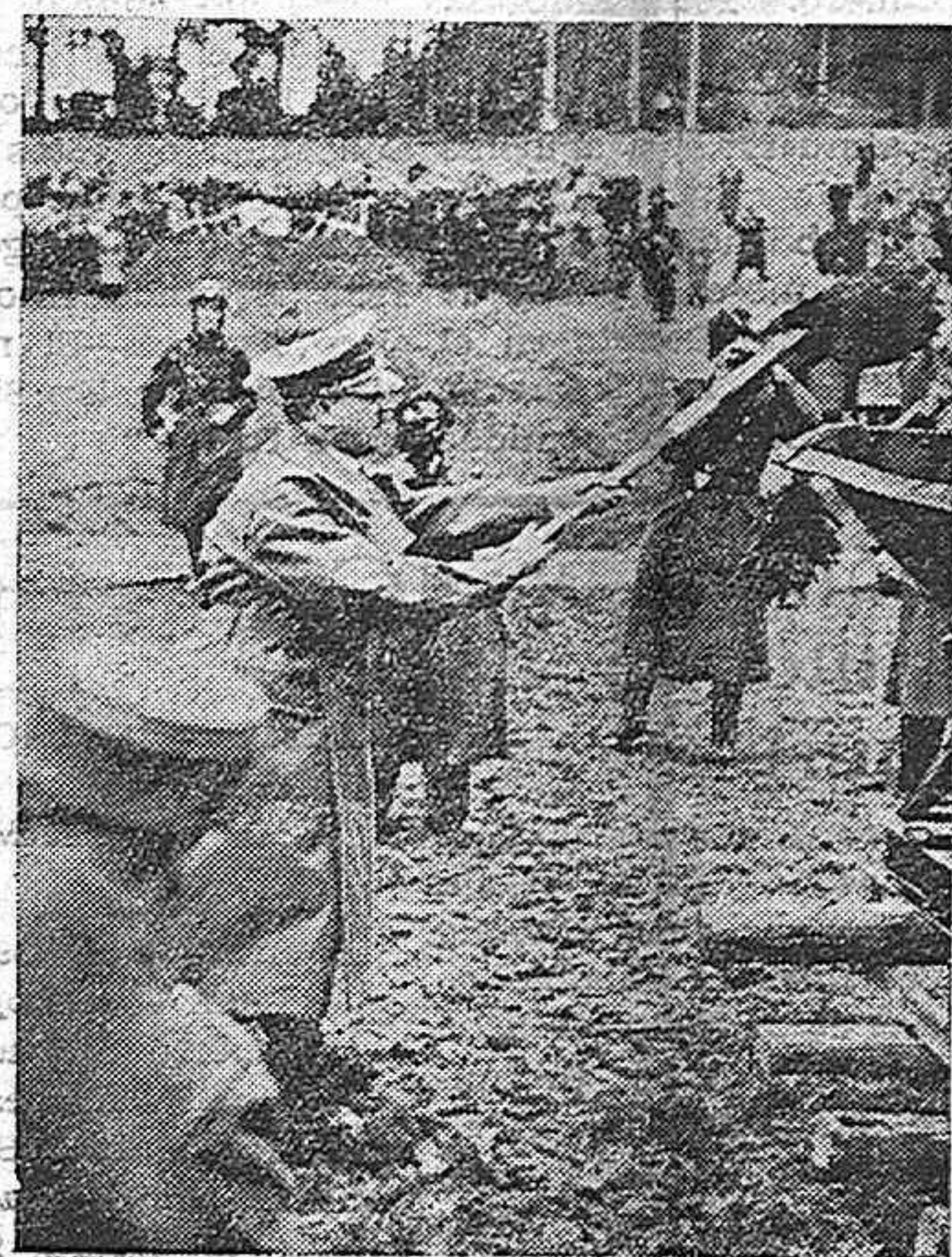
El Führer en el monte de Wals cerca de Salzburg da la señal para que comience la construcción de la Autoestrada Salzburg-Vi. na.

Ambas sentencias se enviaron a la autoridad superior.