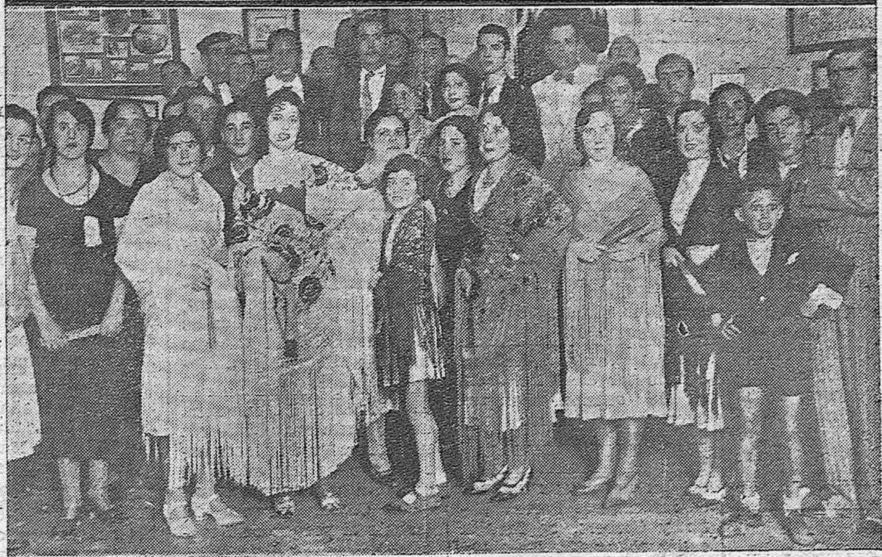
FIESTA SIMPATICA.—Dos aspectos de una verbena celebrada últi mamente por los exploradores en esta capital