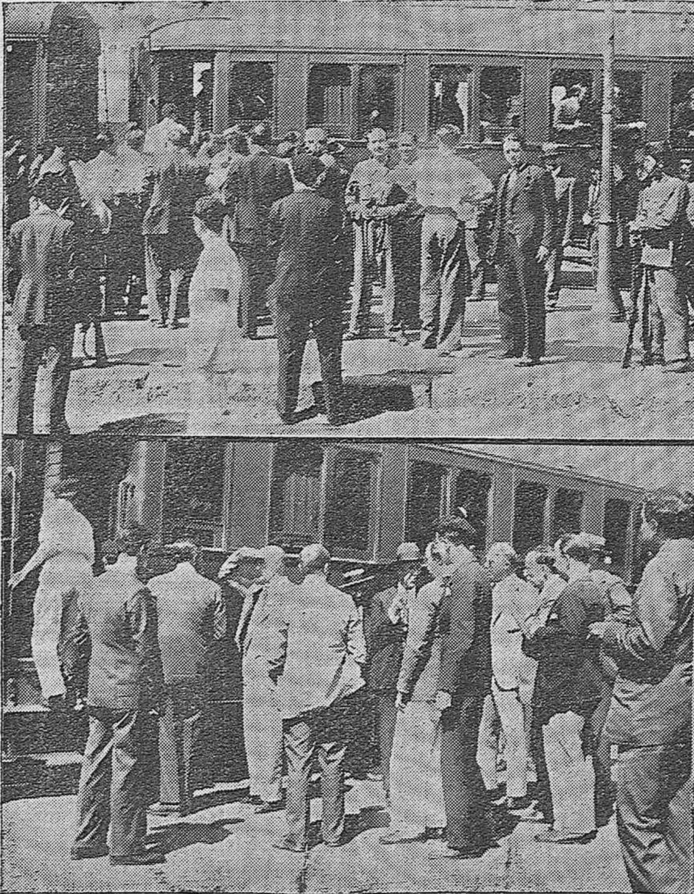
EL PASO POR CORDOBA DE LOS DEPORTADOS A VILLA-CISNEROS. —No obstante las precauciones y las órdenes prohibitivas de aproximarse a los confinados, el reporter logró obtener estas dos interesantes fotos en la estación de Córdoba, cuando atravesaban el andén para subir nuevamente al vagón que los había de conducir a Cádiz.

TRAJES HECHOS: Gran surtido en trajes lana forrados y buena confección a 30, 35, 40, 45 y 50 pesetas en EL METRO y en su Sucursal número 3 calle Concepción, 30.