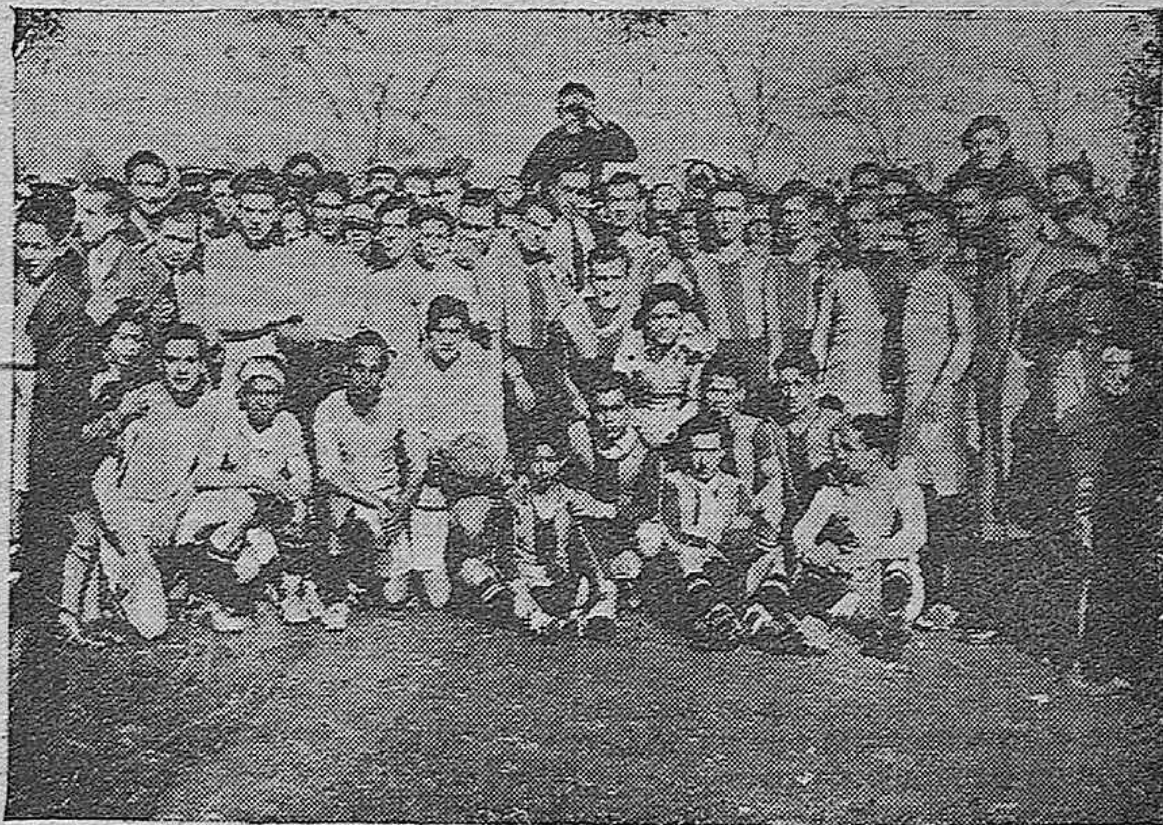
Equipos de jugadores futbolísticos pertenecientes al gremio de obreros tipógrafos que contendieron el pasado domingo celebrando una fecha conmemorativa de su Asociación