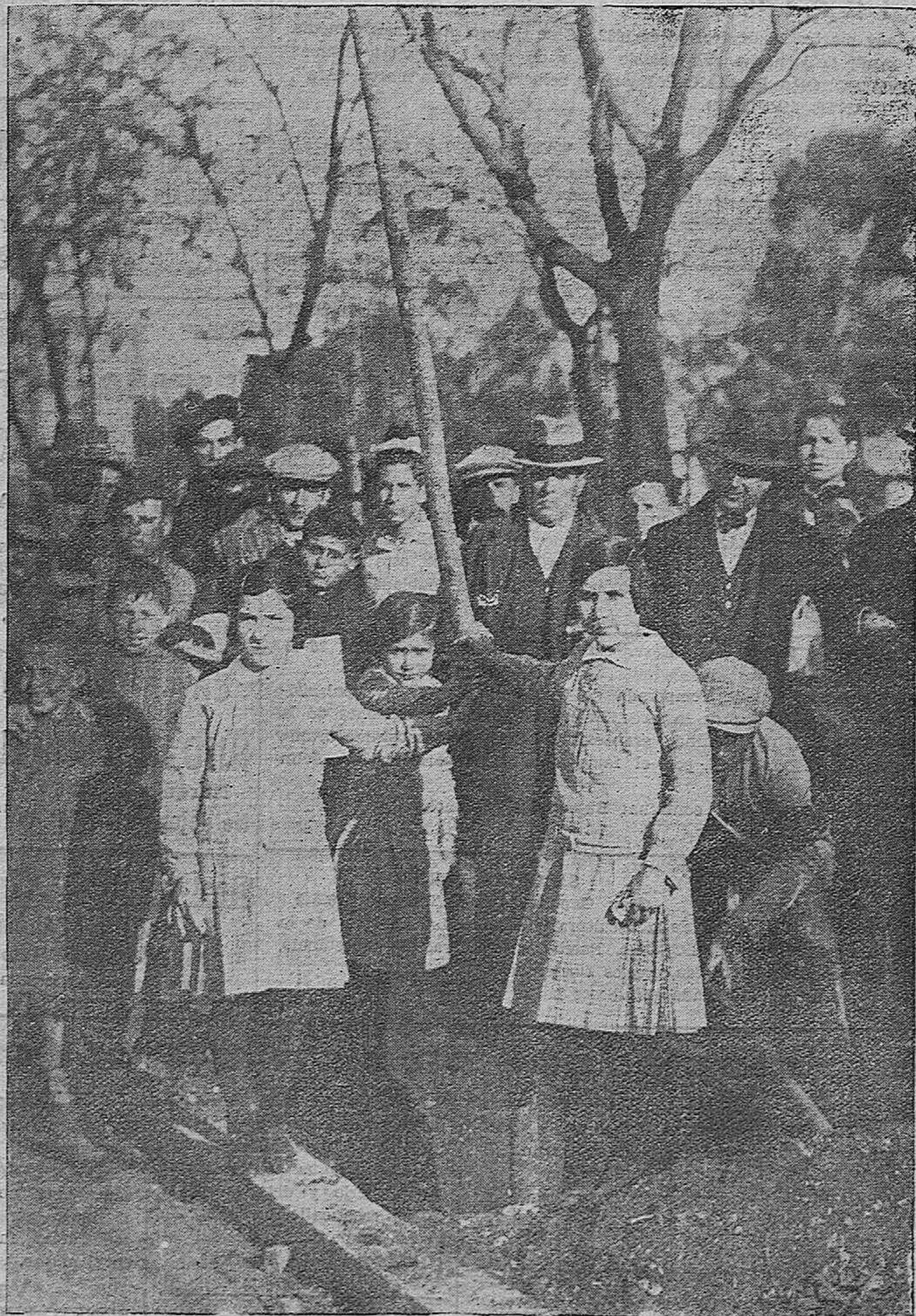
LA FIESTA DEL ARBOL.—Los acogidos de la Casa de Socorro-Hospicio, emplazando sus piantones en la sencilla Fiesta del Arbol celebrada ayer.